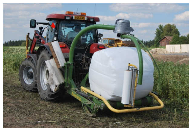
Kuvat 3 ja 4. Vuorokauden esikuivauksen jälkeen härkäpapuraho paalattiin ja paalit kiedottiin muovikalvoon.

Sää niittopäivänä ja seuraavana varsinaisena korjuupäivänä oli aurinkoinen ja erittäin lämmin, lämpötila päivällä oli 25 – 30 °C. Tuuli oli alle 5 ms -1 .