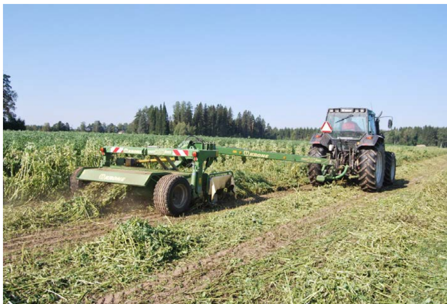
Kuva1. Härkäpavun niitto hinattavalla niittomurskaimella, jonka työleveys oli 3,2 m. Koneen murskainosa oli varstatyyppinen V-mallisin sormin varustettu.

Elokuun alussa 2014 tehtiin härkäpavun korjuukoe Hämeen ammattikorkeakoulussa Mustialan opetus- ja tutkimusmaatilalla. Koelohkoilta korjattu kasvusto oli Kontu-lajike, joka oli kylvetty 15.5. ja 22.5. . Suoraa kasvustoa niittävänä ja silppuavana korjuukoneena oli Luoko-Junkkari-kaksoisilppuri. Toisena koneketjuna oli Krone EasyCut 3210 CV-niittomurskain jonka työleveys oli 3,2 m (kuva 1), Krone Comprima -pyöröpaalain ja Elhon kiedontalaite