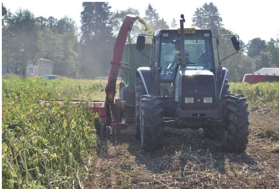
Kuva 2. Härkäpavun toisena korjuukoneena oli kasvustoa suoraan niittävä kaksoisilppuri, jonka työleveys oli 1,7 m.

työkorkeus. Säätypyörää laskettiin niin, että sängin pituus oli noin 10 cm. Heti kaksoisilppurilla tehdyn korjuun jälkeen otettiin korjuutappionäytteet.