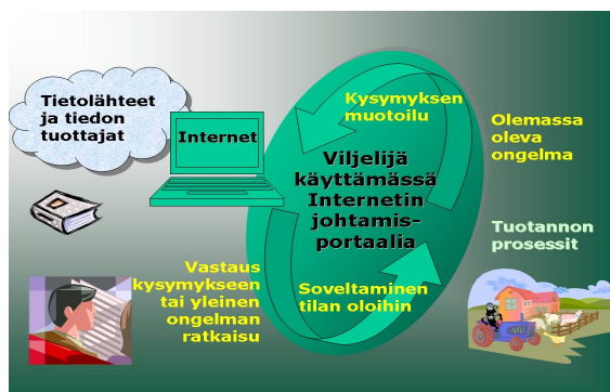
Kuva 2. Jopas- sivuston rakentamisessa lähdettiin liikkeelle maatalan johtamisen tarpeista, tuotantoprosessien ongelmista ja olemassa olevista internet-sivustojen tiedon lähteistä. Informaatio ei suoraan muodostu tiedoksi, vaan vaatii tiedon käyttäjältä osaamista ja oppimiskykyä soveltaa tiedon lähteiden sisältämää informaatiota. (Leppälä ym. 2005).

Internet-aineiston ja hyödyllisten linkkien kerääminen rajoitettiin pääasiassa julkisen sektorin, tieteellisten organisaatioiden tai pitkän liiketoimintakulttuurin omaavien organisaatioiden web-sivustoihin. Hyödylliseksi arvioitu aineisto jäseneltiin mielekkäiksi osa-alueiksi, jotta kokonaisuudesta tuli systemaattisempi ja helpommin hallittavissa oleva. Jäsentämistä ja aineiston etsintää varten tehtiin viljelijäkysely, jonka tuloksia hyödynnettiin aihekokonaisuuksien valinnassa ja painotuksissa.