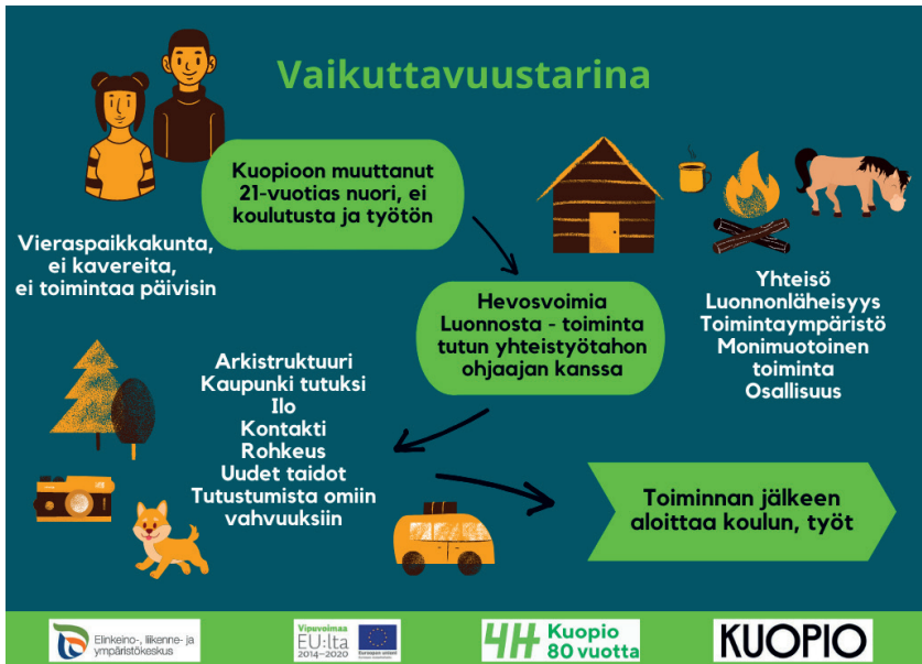
Kuva 2. Hankkeen tuottamien kokemusten pohjalta tiivistetty vaikuttavuustarina