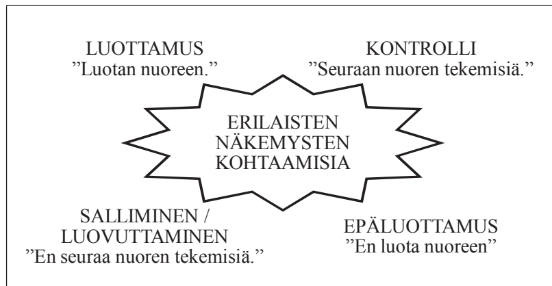
Kuvio 2. Erilaisia näkemyksiä luottamuksesta

Vanhempainilloissa säännöllisesti esiin nouseva luottamuksen käsite kuvaa vanhempien suhtautumista tilanteisiin, joissa vanhempi ei ole valvomassa nuorta. Kouluttajien haastattelujen perusteella vanhempainillan kaltaisessa julkisessa tilanteessa tulee esiin neljä erilaista vanhempain suhtautumistapaa: 1) luottamus, 2) epäluottamus, 3) kontrolli sekä 4) salliminen tai luovuttaminen. Samassa tilaisuudessa nousee esiin useampia, ristiriitaisiakin suhtautumistapoja. Usein pohditaan tiukan kontrollin tai sokean luottamuksen tuottamia riskejä. Parhaimmillaan vanhemmat haastavat keskusteluissa erilaisia näkemyksiä.