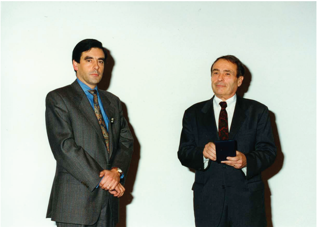
Kuva 2. Tiedeministeri François Fillon ja mitalin vastaanottaja Pierre Bourdieu.

Sen jälkeen Bourdieu kutsuttiin lavalle ottamaan vastaan palkintonsa François Fillonin, nuorekkaan tiedeministerin, kädestä (15 vuotta myöhemmin hänestä tuli Nicolas Sarkozyn pääministeri) ja esittämään kiitospuheensa. Seremonia, jossa samassa hetkessä risteytyivät akateeminen kenttä CNRS:n johtajan edustamana, politiikan ja virkakoneiston kenttä Fillonin henkilöimänä sekä journalistiikan kenttä maan tärkeimpiä