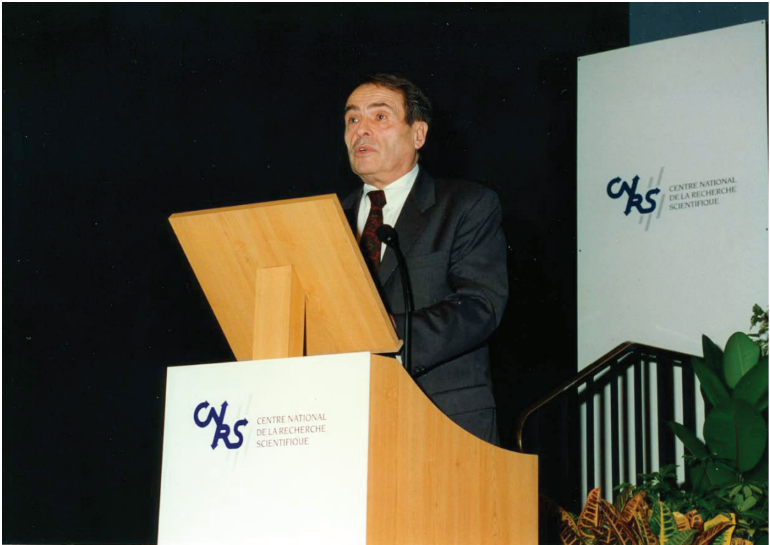
Kuva 3. Bourdieu pitämässä puhettaan.

ja institutionaalisista kiemuroista. 19 Toiseksi ne tekevät tästä ajankohdasta käänteentekevän vuoden Bourdieun intellektuaalisessa kehityksessä . Hän oli lujittanut teoreettisen perustansa ja kruunannut tutkimusagendansa teoksilla La Distinction ja Les Règles de l'art , ja nyt hän avasi tutkimuksissaan uuden vaiheen nostaen etualalle valtion januskasvoisen toiminnan, ryhmänmuodostuksen arvoituksellisen alkemian ja demokraattisen politiikan lunastamattoman lupauksen. Tämä uusi suunta tuli merkitsemään aivan uutta ulottuvuutta hänen symbolisen vallan teoriassaan (ks. varsinkin Bourdieu 1997a, luvut 5 ja 6). Ranskan merkittävimmän tiedepalkinnon saaminen valoi Bourdieuhön itseluottamusta, jota hän tarvitsi ravistaakseen yltään lopullisesti ”hullun sosiologin” ( sociologue maudit ) kaavun ja omaksuakseen täysin Sosiologian kaupungin johtajan ja puolustajan aseman. 20 Se tarjosi myös tarpeeksi lujan tieteellisen taustatuen siihen, että hän antautui kantaaottavammin julkiseen