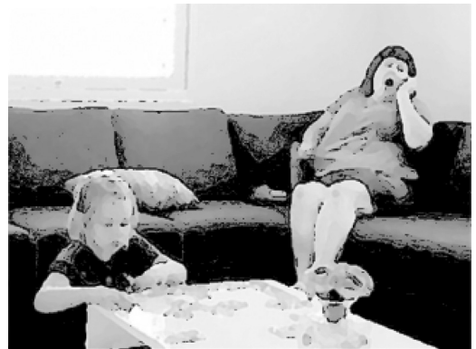
KUVA 1. Äiti aloittaa puhelinsoiton

Aineisto-otteen aikana tyttären katse on palapelissä ja äiti istuu viistosti hänen takanaan sohvalla. Niinpä tytär ei ole huomannut, että äiti on ottanut sohvalla vieressään olleen kännykän käteensä ja aloittanut puhelun (Kuva 1). Tyttären toistuvat avunpyynnöt äidille tulla auttamaan häntä palapelin kokoamisessa ja äidin kieltäytymiset ovat luoneet tietynlaisen yhteisen jatkuvan toiminnan kehyksen tyttären ja äidin välille. Myös heidän kehollinen sijoittumisensa tilaan, lähelle toisiaan, ja tässä asetel-