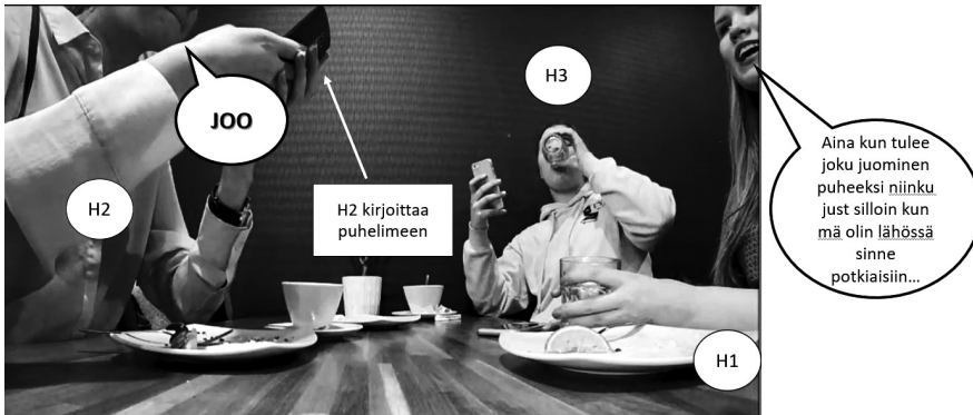
KUVA 3. Laitetta käyttävä pysyy minimipalautteiden avulla keskustelussa mukana