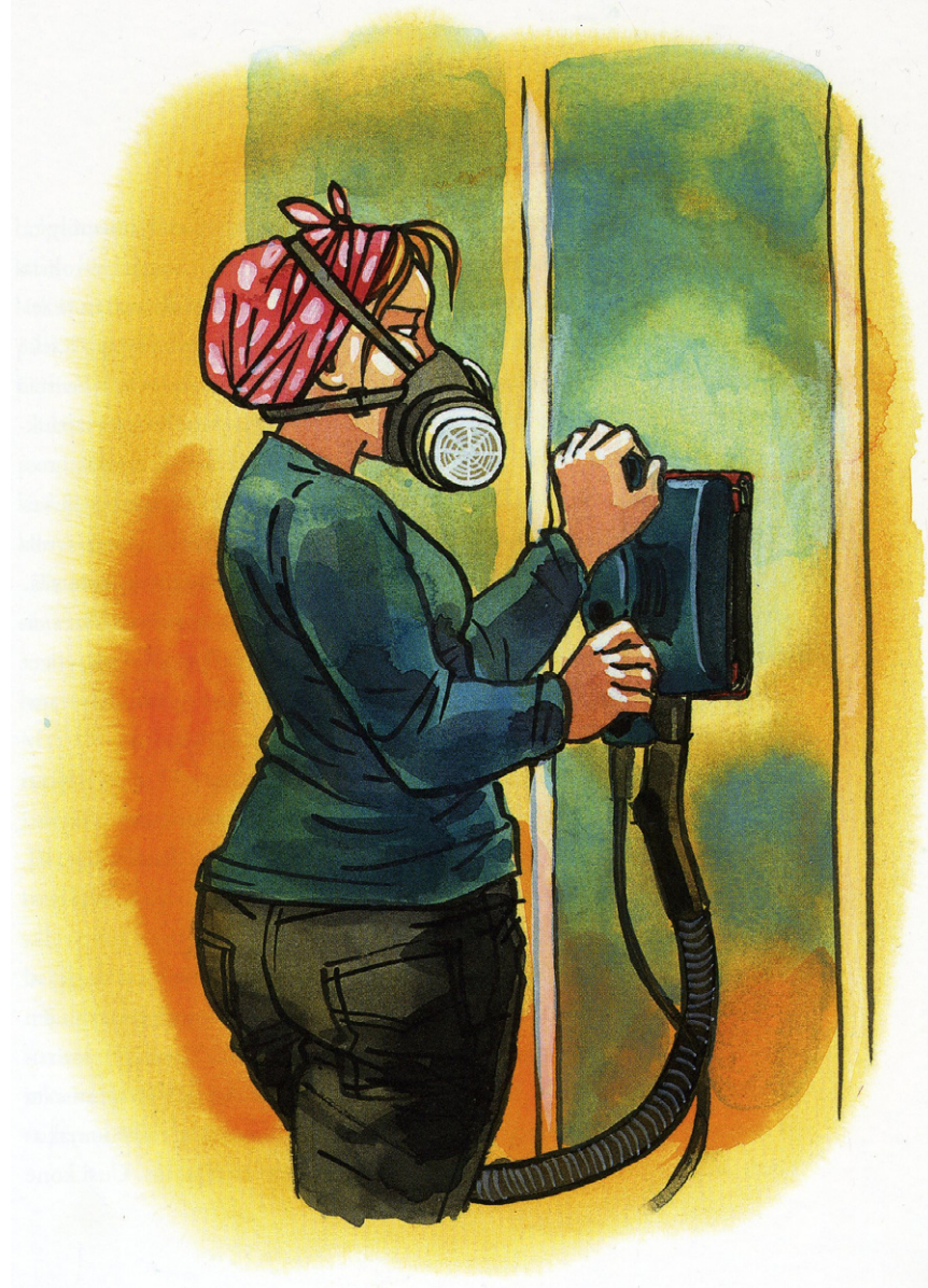
Jokanainen rakentaa ja remontoii (2010) opaskirjan akvarellikuvitukset viittailevat tunnistettaviin voimaantumishahmoihin, kuten Rosie the Riveteriin.

– Ei kaikki ole harkittua ja tietoista valintaa, mutta Kehässä mä en halunnut ongelmallistaa sitä tyttöjen suhdetta tai väittää, että se sinällään aiheuttaisi stressiä Julialla. Kyl mä uskon, että oikeesti, että aika monelle ei-heterolle, nuoruudessa varsinkin, ne ongelmat tulee – siis sellaset, jotka liittyy omaan suuntautumiseen – tulee ulkopuolelta. Ne ongelmat, mitkä on parisuhteessa, mä koen, että ne on samanlaisia oli se puoliso sitten kuka vaan. Kahden ihmisen välillä ongelmat tulee kommunikaatiosta tai sen puutteesta. Mut se, mikä ei-heteroseksuaaleille tekee ongelmia, tulee sitten ulkoapäin, muitten suhtautumisesta.