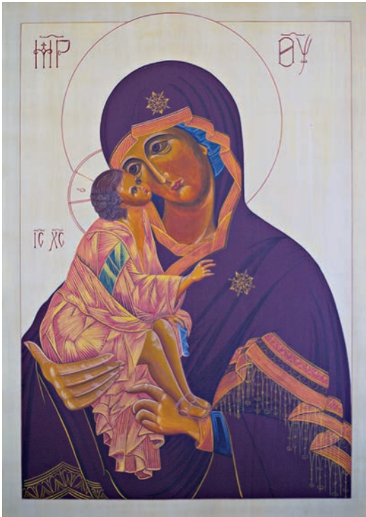
Figur 8. Ikon av typen Gudsmo­dern från Don. Skänkt till kyrkan 1986 av anonym målare.

Kyrkans modernistiska inredning diversifierades i mitten av 1980-talet. Man kan till och med säga att postmodernismens pluralism steg in med betoningen på det lokala. 1986 fick kyrkan motta två donationer. En skulptur som föreställer den korsfäste donerades av skulptören, konstnären och bildkonstläraren vid Övernäs skola i Mariehamn, Dick