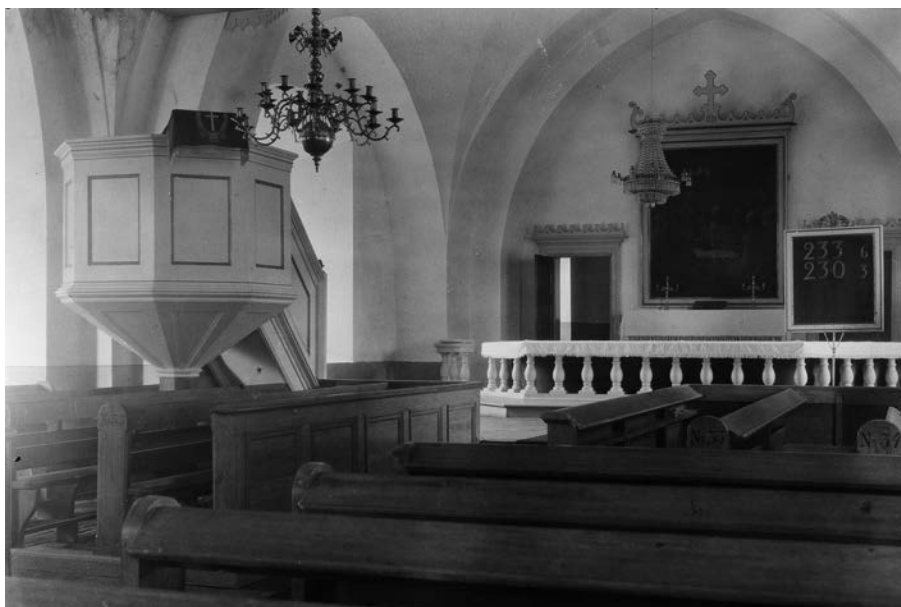
Figur 5. Föglö kyrka, interiör 1929. Foto C.A. Nordman. Museiverkets bildarkiv, MV15374.

Kyrkan som togs i bruk 1862 var nu utvidgad med korsarmar och dess interiör motsvarade väl tidens dekorstil. Altaret som ligger högre i koret än det övriga golvplanet var omgärdat av en altarring. Ekmans altartavla låg ovanför altaret, kantad av enkla vita ramar och guldlistor. Övre kanten var dekorerad med ett träkors och ett vågformat, dekorativt mönster som också upprepades i de övre ramarna på sakristiedörrarna och ännu idag i takfoten på kyrkans utsida. Dekorationssättet var ett uttryck för Chiewitz förkärlek för träsnitt i schweizisk stil i träbyggnader. Kyrkans mångfacetterade predikstol målades vit i enlighet med den övriga interiören och speglarna dekorerades med diskreta förgyllningar. Ovanför predikstolen fanns en baldakin med dekorativa snitt. Rummets ljushet förstärktes av de vitmålade väggarna och takvalvet. Som ba-