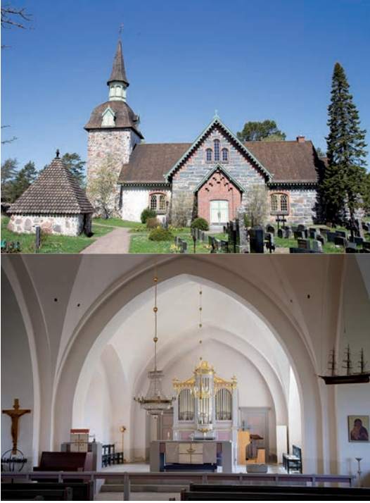
Figur 1. Föglö kyrka. Exteriör och interiör.

avskryva dem från museernas samlingar. 4 Värderingar och värdegrunder har blivit allt viktigare i alla institutioner. Det förs också en aktuell debatt om kyrkornas framtid angående ägande, delaktighet, mångsidigt bruk och ekonomiskt utnyttjande av byggnadsinnehavet. 5 Kyrkornas betydelse för turismen är allmänt erkänd och på Åland har man förstått att uppmärksamma detta sedan gammalt. 6