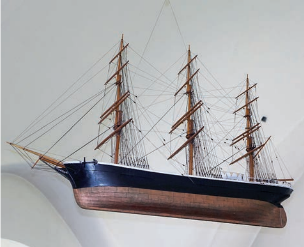
Figur 6. Votivskeppet Gudrun, 1943 av Viktor Andersson.

lanserande kontraster i interiören fungerade bänkar, dörrar och ramlistor, målade i ekfärg. I den tresidiga läktaren mitt emot altaret placerades en mekanisk orgel som