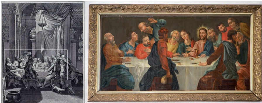
Figur 3. En äldre altartavla målad av Jonas Bergman, Nattvardens 1759. Förebild var en gravyr av Caspar Luyken. Illustration för Christoph Weigels Historiae celebriores Novi Testamenti iconibus representatae... , Nürnberg 1708/1712.

målningar och glasmålningar som hittades i samband med reparationsarbetena på 1960-talet kompletterar de knapphändiga uppgifter vi har tillgång till, men deras datering till medeltiden är osäker. 23