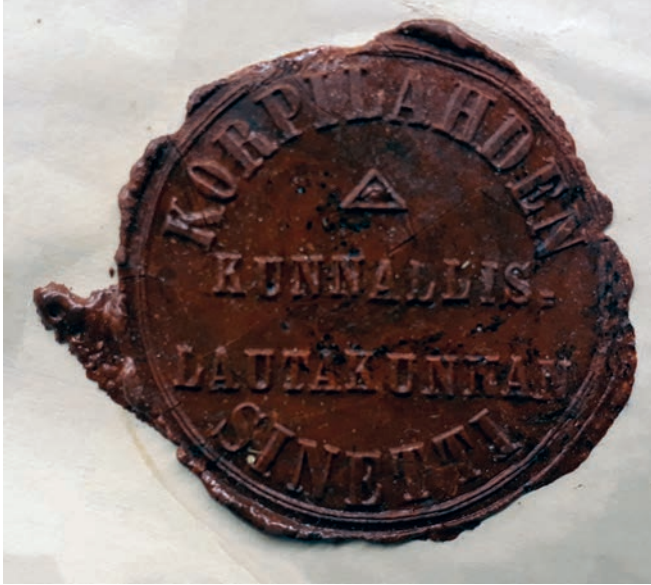
Kuva 2. Korpilahden kunnallislautakunnan sinetti maksusitoumuksessa 1890. Leimasimen halkaisija on noin 34 mm.

mitään pitäjien sineteistä eikä käsitelty lainkaan pitäjien sinettiasioita 1813–1917. On mahdollista, että tuomiokapitulit ovat ottaneet kantaa pitäjien sinetiehdotuksiin, mutta Suomen evankelisluterilaisen kirkon keskushallinnon mietinnössä Kirkolliset vaakunat, sinetit ja leimat (2008) ei mainita sinettiasioita käsiteltyä 1800-luvulla. Suomen ensimmäinen viranomaisia koskeva päätös (156/1919) virastojen sineteistä annettiin vasta itsenäisyyden jälkeen joulukuussa 1919. 8