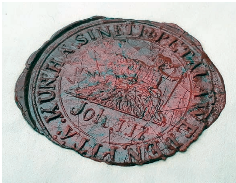
Kuva 3. Petäjäveden kunnan sinetti maksusitoumuksessa 1890. Leimasimen halkaisija on noin 29 mm. Kuvannut Janne Vilkkuna 2019.

”Oi, jospa minun vaellukseni olisi vakaa, niin että noudattaisin sinun käskyjäsi.” 10