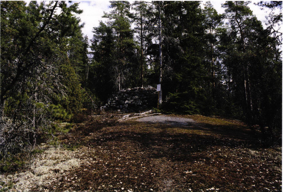
Kuva 2. Eräpyhän röykkiö nykyasussaan. Vuosien mittaan pahoin kärsinyt röykkiö ennallistettiin Helmer Salmon antamien ohjeiden mukaisesti 1966.