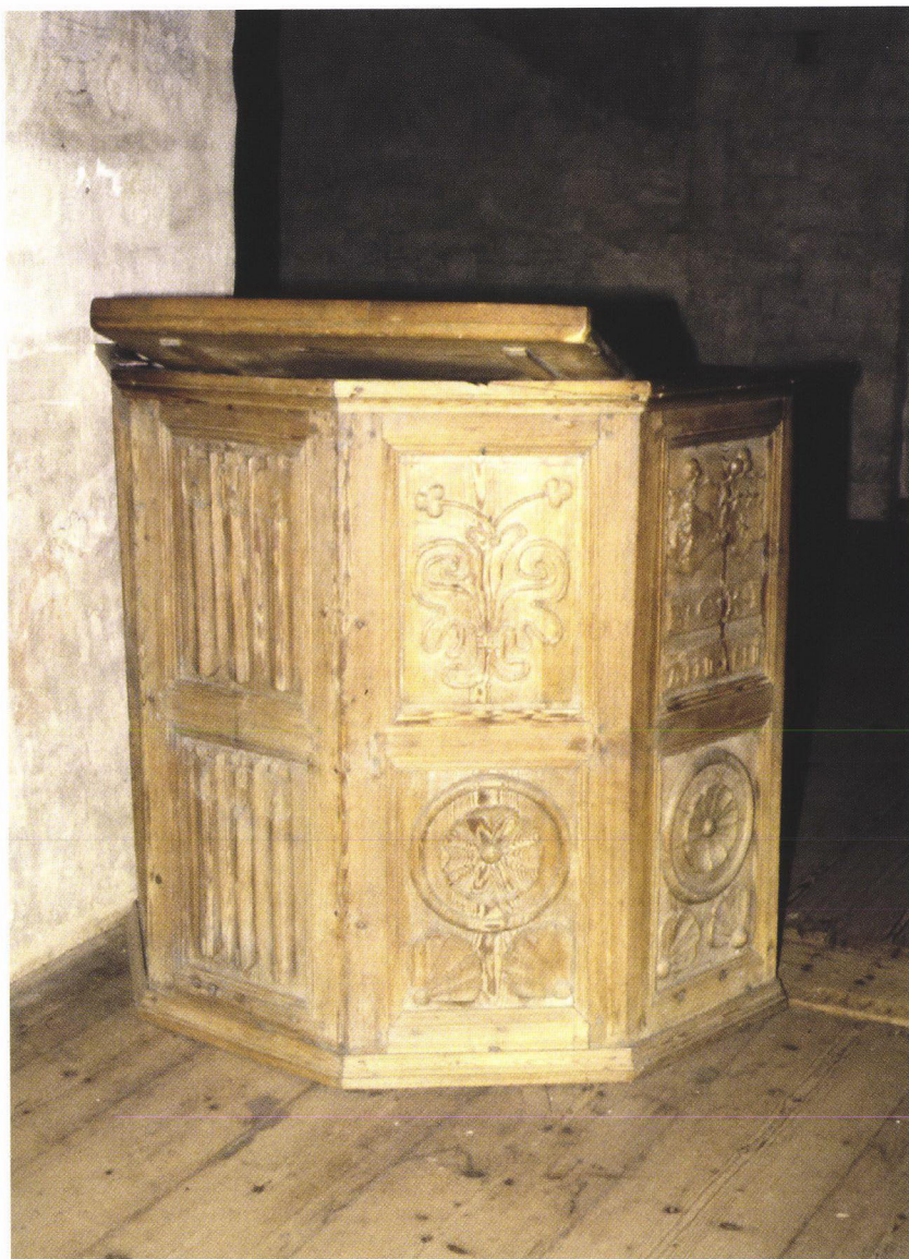
Kuva 1. Hattulan saarnatuoli.

Vaakunoiden perusteella Lepaan suku lahjoitti saarnatuolin Hattulan kirkkoon vuonna 1550. Valtaneuvos Björn Klaunpojan ja hänen ruotsalaista yläaatelista sukua olleen vaimonsa Karin Göränintytär Stiernsköldin vaakunat on veistetty yhteen saarnatuolin paneeleista. Lahjoitus liittyyne samana vuonna kuolleen herra Björnin muiston kunnioittamiseen. 6