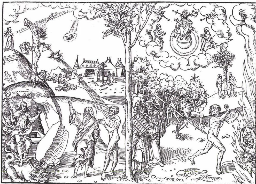
Kuva 4. Lucas Cranach vanhempi. Uusi ja Vanha ja testamentti (n. 1529).

samoin kuin eron teko muihin protestantteihin tuli tärkeäksi. Lutherin kuoleman jälkeen sisäiset tunnustukselliset kiistelyt olivat leimanneet eri leireiksi pirstoutunutta luterilaisuutta. 1570-luvulla käynnistettiin työ kiistakysymysten ratkaisemiseksi. Työn tulos Formula Concordiae ('Yksimielisyyden ohje') oli muotoiltu kirjalliselta asultaan yksinkertaiseksi ja maallikoillekin ymmärrettäväksi ratkaisuksi opin tulkinnan ristiriitoihin luterilaisuuden sisällä. Luterilaisten tunnustuskirjojen kooste Liber Concordiae ('Yksimielisyys') julkaistiin Augsburgin tunnustuksen 50-vuotispäivänä juhannuksena 1580. Keskenään kiistelevistä rintamista voittajaksi selvisi gnesioluterilaisuus ('aitoluterilaisuus'), joka tarjosi perinteeseen ankkuroituvan selkeän luterilaisen identiteetin. Tämä yhtenäisyyden osoitus merkitsi kiistojen lientymistä luterilaisuuden piirissä. Samaan aikaan myös Ruotsin kirkkoa ravistaneet syvimmät epäluottamuksen ristiriidat laukesivat ja kehitys johti Rostockin yliopiston ja David Chytraeuksen vaikutuksen kasvuun. Samaan aikaan kuningas Juhana III:n kirkkopolitiikan suunta kääntyi, kun katolista kirkko lähentymään pyrkineet ireeniset intressit kariutuivat lopullisesti vuonna 1580. 12