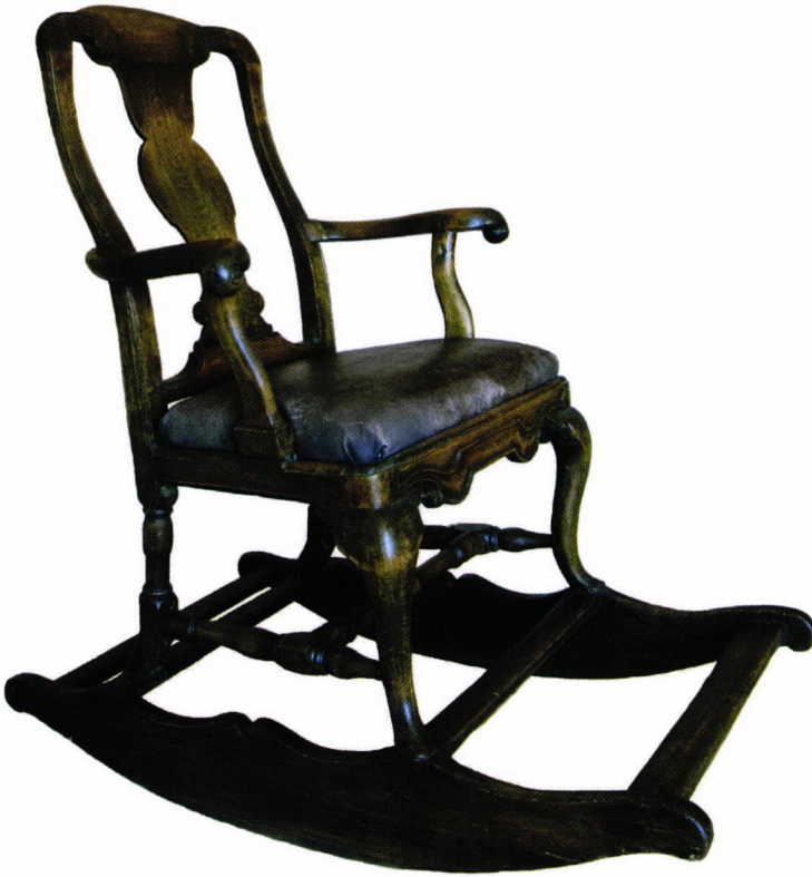
Kuva 1. Keinutuoli. Istuinosa ruskeaksi petsattua lehtipuuta, jalakset havupuuta. Istuimen nahkaverhoilu uusi. Lahjoittaja neiti Stigell 1913. Porvoon museo inv. nro 3675.

vat vaakatasossa voimakkaan S-kaaren. Tuolin selkänöjan sivupuut ja balusterinmuotoinen pystylauta kaartuvat yläosastaan ulospäin myötäilemään anatomisesti istujan selkää. Tällaiset tuolit olivatkin huonekaluhistorian ensimmäiset, joissa ihminen saattoi istua todella mukavasti. Puulaji on lehtipuuta, joka on petsattu tummanruskeaksi; jalakset ovat havupuuta. Sarjaan upotetun irtoistuimen verhoilu on todennäköisesti ollut nahkaa, nykyinen nahkaverhoilu on kuitenkin uusi.