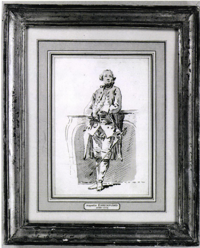
Kuva 4. Augustin Ehrensvärd (1710–1772). Tussilaveeraus, J. E. Rehn, luultavasti 1760-luvun lopulta. Yksityisomistuksessa Ruotsissa.