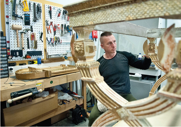
Kuva 7. Konsolipöytä tarkasteltavana konservoinnin aikana.

re-konsolipöytien tukholmalaislähtöisyys tuki näin myös valmistuspaikka-pohdintaa. 43