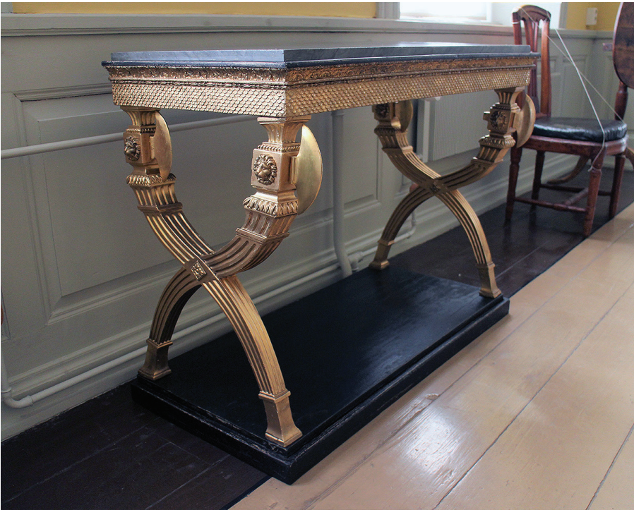
Kuva 8. Konsolipöytä konservoinnin jälkeen näytteille asetettuna Roosin talon keltaisessa förmaakissa.

Näkyvät vauriokohdat korjattiin maalin poiston jälkeen eläinliimaa, puuta ja puukittiä käyttäen. Yläsarjan sisäosaan ei koskettu. Kultauksen kerroksellisuus säilytettiin niin, että sitä paikattiin puuttuvilta osin öljykultauksena lehtikullalla, muilta osin vanhat kultauskerrokset retusoiittiin. Retusointikohdissa havaittuja vaurioita pohjustettiin tarvittaessa liitu-eläinliimaseoksella. Sarjan yläosa ja jalkalevy käsiteltiin vernissa-puutärpähti-pigmenttiseoksella, ja tämän kuivuttua pintaa tasoitettiin öljyhionnalla ohennettua vernissaa sekä erittäin hienoa vesihiomapaperia käyttäen. Lopuksi kansi puhdistettiin siihen soveltuvalla aineella. 46