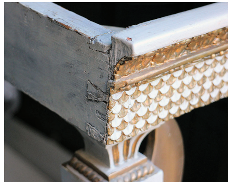
Kuva 6. Konsolipöydän yksityiskohtia ja pintakerroksia ennen konservointia.

Seuraavassa vaiheessa tuli ajankohtaiseksi selvittää tarkemmin pöydän mahdollinen alkuperäinen ulkoasu. Eri lähteistä selvitettiin aikakaudella vallinneita työtapoja sekä mahdollisia väri- ja kultausyhdistelmiä. Työkohteena olevaan pöytään vertautuvista saman aikakauden konsolipöydistä löytyi tietoja kohtuullisen helposti. Kuvaavia piirteitä näissä olivat tummahko marmorikansi, kullattu