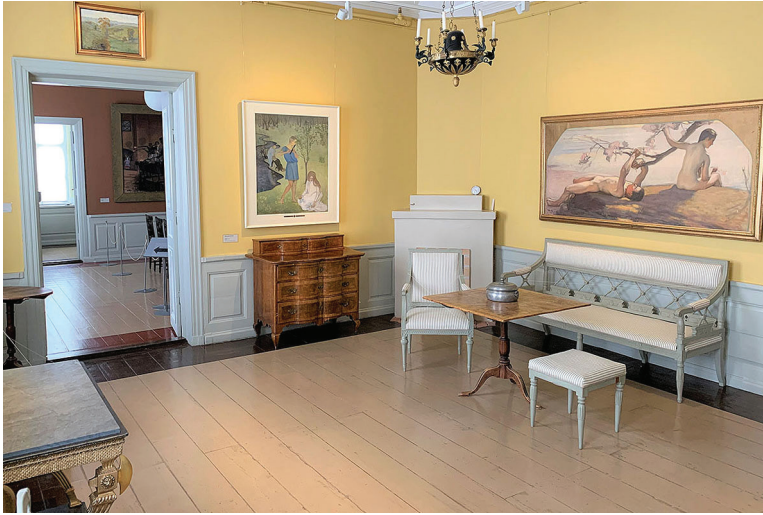
Kuva 5. Roosin talon keltainen förmaaki eli vierashuone nykyisessä asussaan.

Tätä taustaa vasten voidaan tarkastella keisarin vierailun olosuhteita tuolisessa Roosin talossa. Alakerros oli perheen arkikäytössä ja toinen kerros sisustettuna juhlatilaisuuksia varten. Kertoman mukaan kauppias Roos ei ollut säästellyt kuluja saadakseen yläkerroksen huoneet keisarin vierailuun soveltuviksi. Mainitaan myös, että Roos oli varta vasten tilannut Tukholmasta kokonaisen förmaakin kaluston vierailua varten. 24 Olihan maaherra de Carnall hiljattain kehottanut juuri tällaisia järjestelyjä. 25 Syytä siihen, miksi huonekalut hankittiin Tukholmasta eikä esimerkiksi Pietarista voidaan vain pohtia, sillä Roosin kauppahuoneen arkistoa ei ole säilynyt, ja myös muuta sukuun liittyvää kirjallista aineistoa on säilynyt äärettömän vähän 26 . Ulkomaankaupan painopiste oli 1820-luvun lopulle saakka edelleen Tukholmassa, joten todennäköisenä syynä voidaankin näin pitää vanhoja kontakteja entiseen pääkaupunkiin. 27