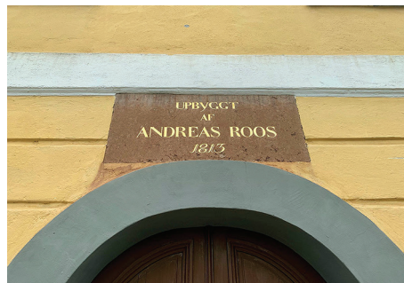
Kuva 4. Roosin talo valmistui Kokkolan Isokadun varrelle vuonna 1813.

Vierailu ja vastaanotto tapahtuivat Kauppias Anders Roosin talossa, ja tämän talouden olosuhteita sekä isäntäväen varallisuutta voidaan tarkastella useisiin lähteisiin perustuen. Anders Roos vanhempi (1750–1810) mainitaan 1800-luvun alkuvuosina sekä Kokkolan, että koko Suomen rikkaimpana kauppaporvarina. 21 Netto-omaisuuden arvo oli hänen kuollessaan vuonna 1810 kokonaista 215 000 riikintaalera. 22 Omaisuus kasvoi edelleen liike toimien siirryttyä hänen pojalleen Anders Roos nuoremmalle (1785–1842) ja oli lopulta suurimmillaan 1830-luvun aikana 23 . (Kuva 4.)