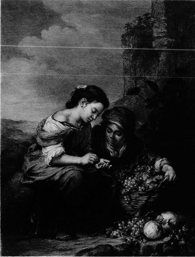
Kuva 8. Rahoja laskevat tytöt. Murillon mukaan Wilhelm Hecht, kupari-kaiverrus. Kok. Antell / Collan, Sinebrychoffin taidemuseo.

jana säätyvaltiopäiviin 1882–1906, ja hänen kannanottonsa koskivat pääasiallisesti terveydenhoitoa. 31