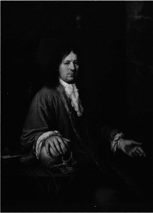
Kuva 6. Lääkärin muotokuva, 1648. Abraham de Snaphaen, öljy kankaalle 34 x 25,5 cm. Von Haartmanin kokoelma, Sinebrychoffin taidemuseo.

1690) Laidunmaisema . Bergenin teoksessa on kuvattu alankomaalaisille vaurautta ja ravintoa symboloiva karja laiduntamassa levollisesti metsäisessä maisemassa. Holsteinista kotoisin olevan Rembrandtin oppilaan Jürgen Ovensin (1623–1678) mytologisaiheisen tuotannon huipputeoksia kokoelmassa edustaa metsästyksen jumalattaren lepohetki Diana seurueineen .