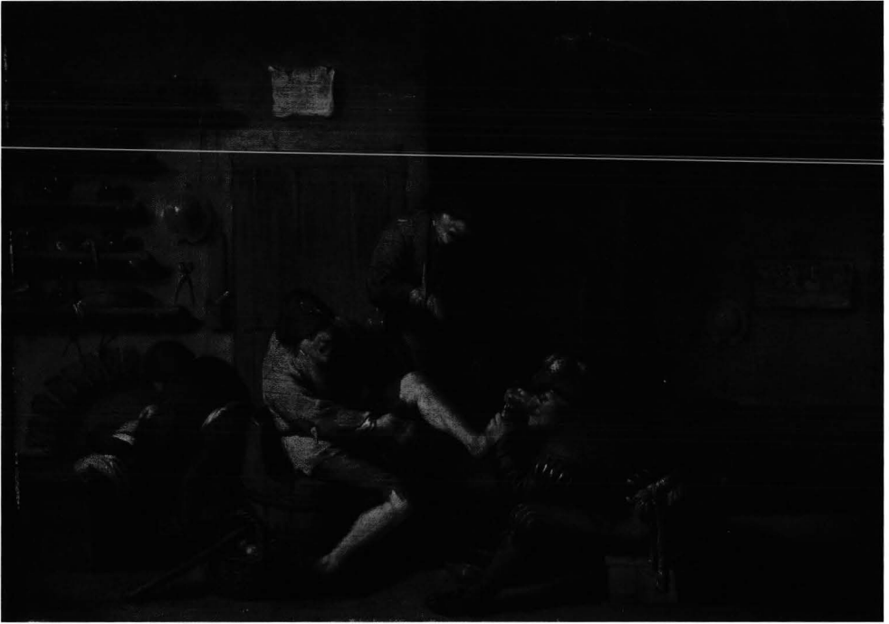
Kuva 5. Tuntoaisti / Puoskari ja kaksi potilasta, 1600-luku. Tuntematon taiteilija Adriaen van Ostaden mukaan. Von Haartmanin kokoelma, Sinebrychoffin taidemuseo.

Von Haartman pyrki muodostamaan edustavan taidekokoelman, johon kuului tunnettujen mestareiden maalauksina pidettyjä kohtuuhintaisia teoksia. Useimmat teoksista ovat myöhemmin osoittautuneet koulukuntatöiksi tai kopioiksi. Kai Kartio painottaa Carl von Haartmania koskevassa artikkelissaan (1994), että mestareiden koulukuntatyöt ja kopiotkin ovat lajissaan merkittäviä taideteoksia, jotka mm. johdattelevat katsojan hollantilaisen 1600-luvun taiteen moneen keskeiseen aihepiiriin, taiteilijoiden näkemyksiin ja työskentelytapoihin. 19