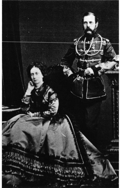
Kuva 4. Keisari Aleksanteri II ja keisarinna Maria Aleksandrovna.