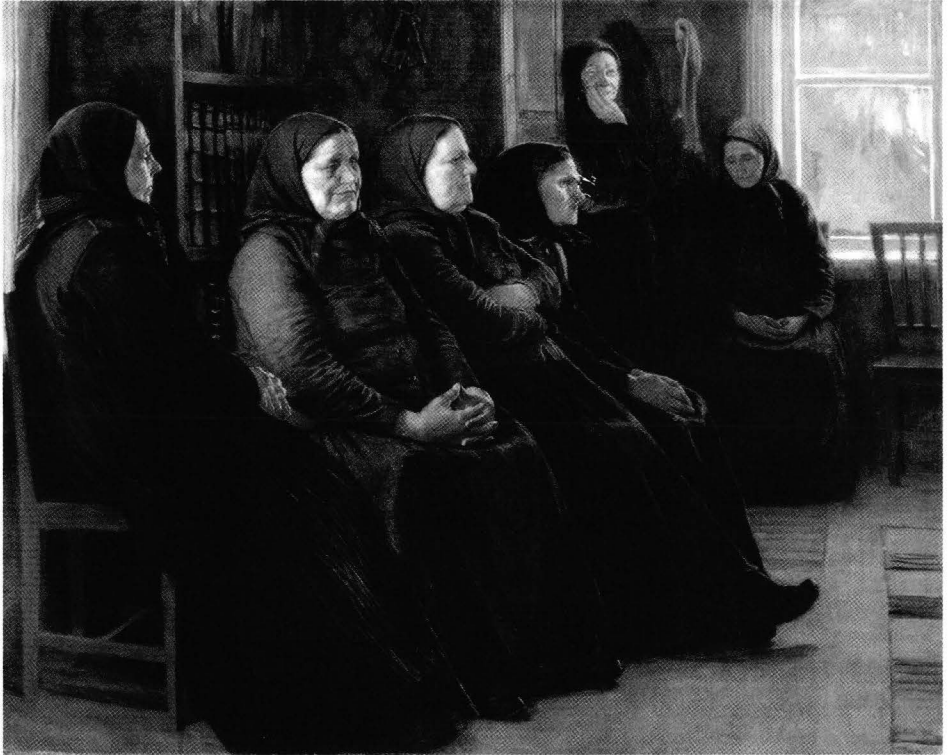
Kuva 1. Savolaisia heränneitä. Venny Soldan-Brofeltin maalaus vuodelta 1898. Ateneumin taidemuseo.

Fig. 1. Pietists of Savo. Painting by Venny Soldan-Brofelt from 1898. The Ateneum Art Museum.