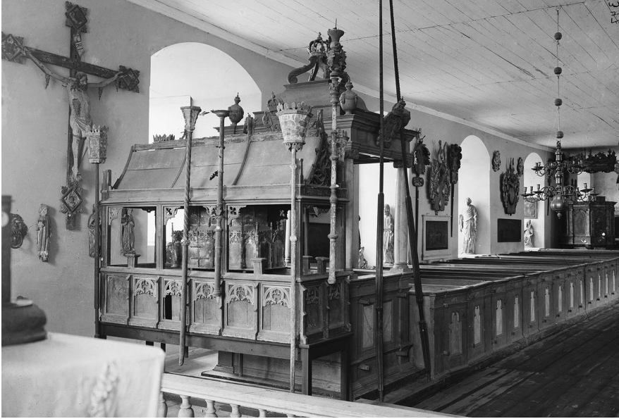
Bild 3. Det s.k. Hemmingskrinet från Åbo Domkyrka och andra kyrkliga föremål tillfälligt utställda i Åbo slotts kyrka.

jade de bortglömda föremålen inventeras utan stor entusiasm: "Några stycken gamla träbilder stå här och där kring kyrkan, som man ej håller mödan värt att upräkna, och annat dylikt" var den första beskrivningen av skulpturerna. På 1800-talet väckte skulpturerna nytt intresse och fick en ny roll som kvarlevor av kyrkans historia. Helgonkulten hade redan blivit så främmande att nya meningar kunde projiceras på bysten: den kallades Jungfrun från Venngarn och associerades till en lokal (tydligt helgonlegendinspirerad) tradition om hjältinnan Disa. 60