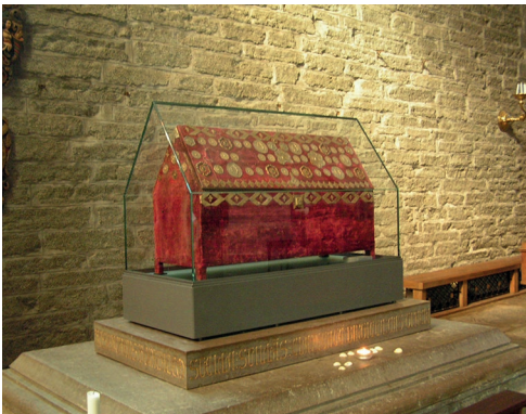
Bild 1. Relikskrinet som överlevde i Polen, Vadstena klosterkyrka.