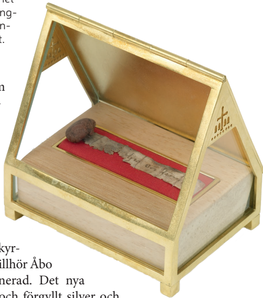
Bild 5. Det nya Henrik-relikvariet i katolska kyrkan, Helsingfors.

har de inte en likadan roll som på medeltiden: under medeltiden aktiverades armrelikvarier i biskopens hand för att välsigna församlingsmedlemmarna, nu är den rekonstruerade armen innesluten i en monter.