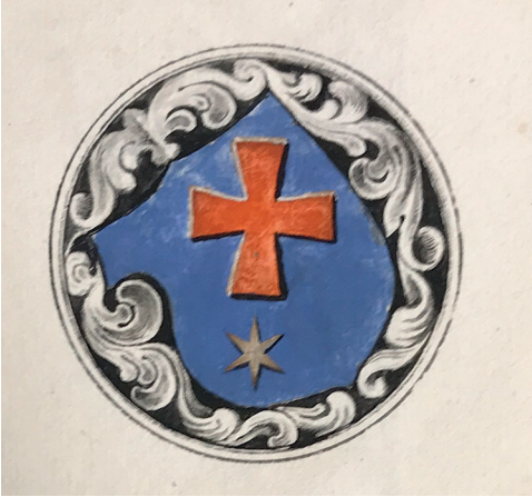
Kuva 1. Elias Brennerin vesivärein väritetty piirros Espoon kirkosta. Piirroksessa kuvattu Särkilahti-suvun lasimaalausvaakuna. Gamble Monumenter I Stoor-Förstendömet Finnlandh affrijtade Anno 1671 och 672 aff Elia Brennero Ostrobothniensi s. 34.

Carl Axel Gottlundin (1796–1875) vuoden 1831 teoksessa Otawa eli Suomalaisia huvituksia I . Eliel Aspelinin Brenneriä koskeva akateeminen elämäkertatutkimus on vuodelta 1896. Sata vuotta myöhemmin Åsa Ringbom puolestaan kävi artikkelissaan läpi Brennerin tutkimusmatkaa sekä sen tuloksena syntyneitä julkaisuja. Hän analysoi eri julkaisuversioiden eroja ja samankaltaisuuksia löytäen eri versioiden välillä eroja esimerkiksi kuvien laadussa ja tarkkuudessa. 8