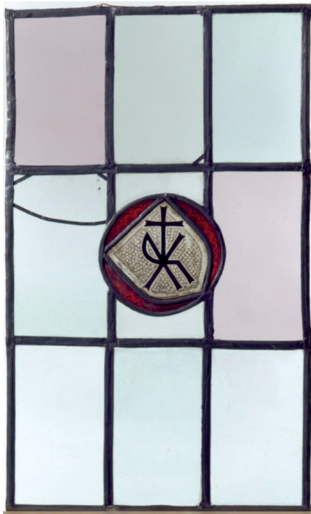
Kuva 3. Lasimaalaus Pappismiehen vaakuna KM 4419:4. Kuvassa vaakunakilpeä ympäröivät punaiset ruusumaiset kuviot.

Brennerin teoksen ensimmäinen lasimaalauskerkko on Maaria eli Räntämäki, Brennerin teoksen sivulla 14. Sieltä on kuvattu kaksi lasimaalausvaakunaa. 28 Toinen vaakunoista kuuluu piispa Olavi Maununpojalle, ja sen yhteydessä on kuvattu keltainen koristeltu mitra eli piispanhiippa. Abildgaardin piirroksissa kyseiseen vaakunaan ei liity mitraa, ja vaakunakilven kuvassa on pieniä eroja. 29 Onko Brennerin kuvaama mitra mahdollisesti ikkunan yhteydessä ollut holvi- maalaus vai todellinen lasimaalauksen osa? Tanskassa Ubberudin kirkon