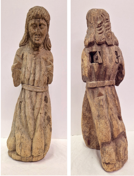
Kuva 5. Mahdollisesti Pyhää Mikaelia esittävä veistos H22998, Turun kaupungin taidekokoelma.

pahvikortiston käyttöönotto olivat selvä parannus entiseen, kirjanpito ei edelleenkään ollut aukotonta. Esineitä oli jäänyt aiemmilta ajoilta luettelomatta, ja uusiin järjestelmiin saatettiin kirjata virheellisiä tietoja. Näiden tietojen todenperäisyyttä joudutaan kyseenalaistamaan aika ajoin edelleen