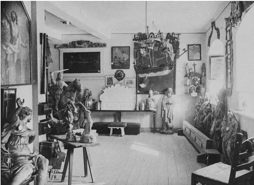
Kuva 2. Postikorttikuva Turun linnan näyttelystä n. 1895–1909. Kuvassa näkyy muun muassa Sundin kirkosta peräisin oleva Pyhä Yrjänä ja lohikäärme (H4758), ja etummaisena oikealla Ruskon Neitsyt Maria (H4762). Jalkapuiden vieressä vasemmalla on Turun tuomiokirkon kokoelmiin kuuluva Pyhä Antonius, joka kuvanottohetkellä oli tallettuna Turun kaupungin historialliseen museoon. Tuomiokirkosta talletettiin museolle kirkollisia esineitä vuonna 1893.