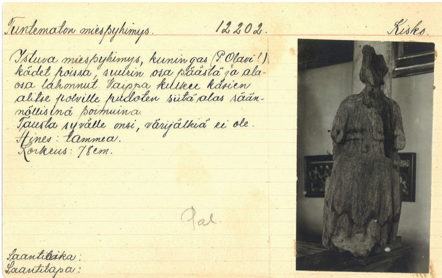
Kuva 4. Tuhoutuneen veistoksen 12202 pahvikortti.