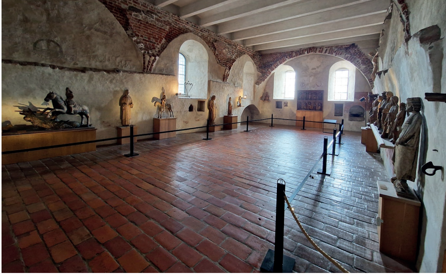
Kuva 1. Turun linnan Sturenkirkko.

on tullut sekä ostojen että lahjoitusten kautta, ja niiden tunnukset paljastavat jonkin verran tietoja veistosten mahdollisista tuloajankohdista.