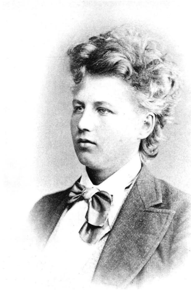
Kuva 1. Valokuva Otto Walleniuksesta nuorena opiskelijana.

vuonna Wallenius osallistui salonkiin, maalauksella »Pêcheuse finlandaise» – »Kala- tyttö, nuottaa vetämässä» 25 .