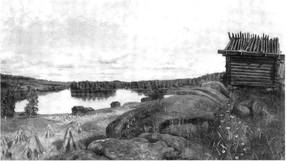
Kuva 9. Otto Wallenius, Peltomaisema. Öljy kankaalle, 81 x 141. Museovirasto, Cygnaeuksen galleria.

oli Wallenius jo palannut, ja liittyi Emmyn ryhmään yhtenä sen kantavista voimista. 59 Hänestä tuli Achtén perheessä hyvä tuttu. Tytär Aino muisteli lapsuudenkotinsa illanviettoja: »— — laulettiin ja soitettiin yöt läpeensä, nuori Oskar Merikanto tavallisesti pianon ääressä. Äitini laului silloin mukaansatempaavalla, dramaattisella tavallaan, joko yksin taikka duettoja Abraham Ojanperän tai Otto Walleniuksen kanssa». 60 Emmy Achtén »Kotimaisen oopperan» näytännöt kestivät kevät- ja syyskauden 1892, jonka jälkeen Wallenius pääsi urallaan ratkaisevasti eteenpäin: hänet hyväksyttiin laulajaksi Tukholman kuninkaalliseen oopperaan. Tukholmassa hän sai mm. esittää keskeistä, jo Achtén esityksiin harjoittelemaansa kreivi Lunan roolia Verdin oopperassa »Trubaduuri». Wallenius toimi kuninkaallisessa oopperassa tietävästi vuoteen 1895 saakka. 61