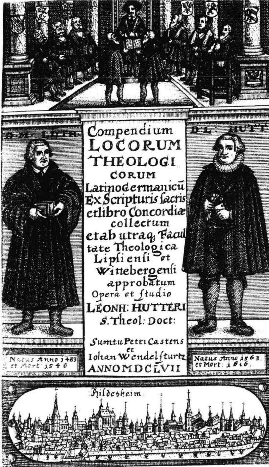
Kuva 1. Wittenbergiläisprofessori Leonard Hutterin Compendium saavutti tärkeän aseman ortodoksian ajan teologisena mallina.

Erityinen Luther ja Melanchthon -muotokuvien kukoistusiämiö ajoittuu Ruotsissa 1630-luvulta 1680-luvulle. Ilmiöllä on selkeärajainen esiintymisalueensa eteläisessä Västmanlandissa. 19 Varhaisin ruotsalaisista paneeleista on peräisin vuodelta 1638. Nuorin ajoittuu vuodelle 1680. Nämä Luther ja Melanchthon -muotokuvat sijoittuvat saarnatuolin takapaneeliin. Muotokuvaparin keskellä on Pyhää Kolminaisuutta symboloiva tetragrammi tai Jahwen aurinko. Molemmat symbolit liittyvät yleisesti saarnatuoleihin. Usein tetragrammi tai aurinko koristavat saarnatuolin kaikukatoksen sisäkattoa.