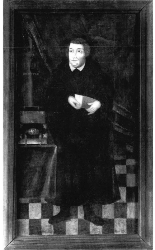
Kuva 5. Luther vuodelta 1694 Koivulahden kirkosta.

Reformaattorimuotokuvia maalattiin myös lehtereiden kaidepanelointeihin. Luther ja Melanchthon -aiheet kuuluvat Sauvon kirkkoon vuonna 1695 maalattuun laajan kokonaisuuteen. Piispa Johannes Gezelius nuorempi, joka toimi Sauvon kirkkoherrana piispanvirkansa ohella, vastasi lehterinkaiteteisiin toteutetun traditioteologisen kuvaohjelman suunnittelusta. Etelälehterin länsivuun kuvatut hahmot liittyvät teemallisesti kirkon historiaan. Turun marttyyripiispa Henrikin lisäksi sarjaan kuuluvat Jan Hus, Martti Luther ja Filip Melanchthon. 33