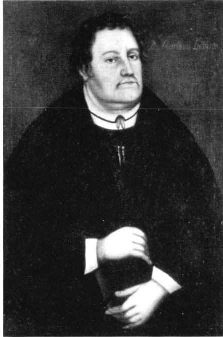
Kuva 3. Melanchthon ja Luther -muotokuvat Hattulan kirkosta.

lan vanhasta kirkosta on peräisin Lutheria ja Melanchthonia esittävä maalauspari. Kookkaat puolivartalokuvat pohjautuvat uskollisesti Cranach-grafiikan malleihin. 28