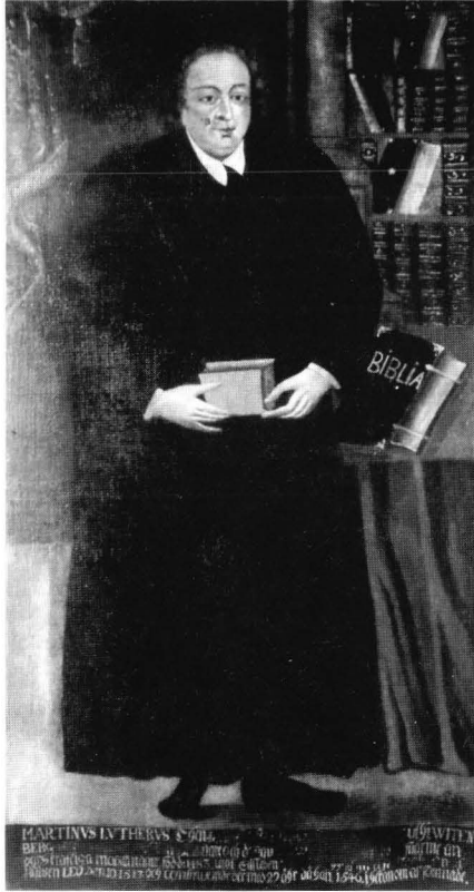
Kuva 4. Taipalsaaren kirkosta peräisin ollut Luther vuodelta 1691 on kuulunut Viipurin museon kokoelmiin.