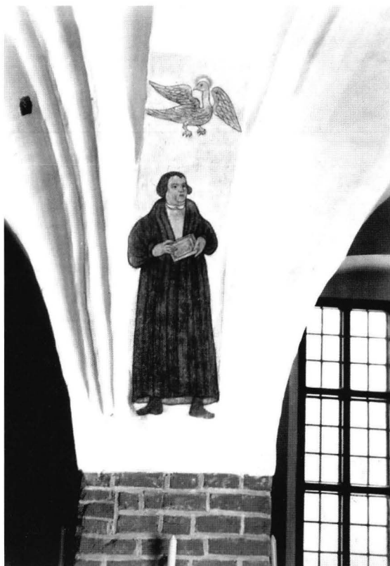
Kuva 6. Lemun Luther vuodelta 1692.