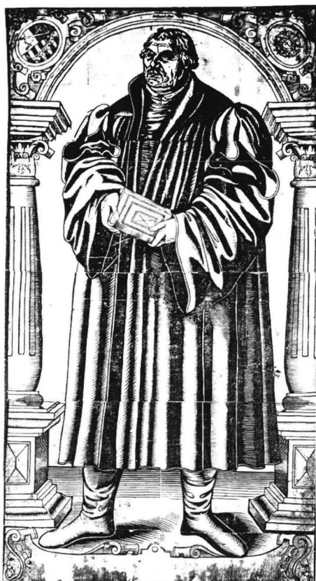
Kuva 2. Cranachin työpajan tuotteisiin kuului myös jättiläiskokoisia reformaattorimuotokuvia. Melancthon ja Luther -hahmot koostuvat yhdestätoista arkista.