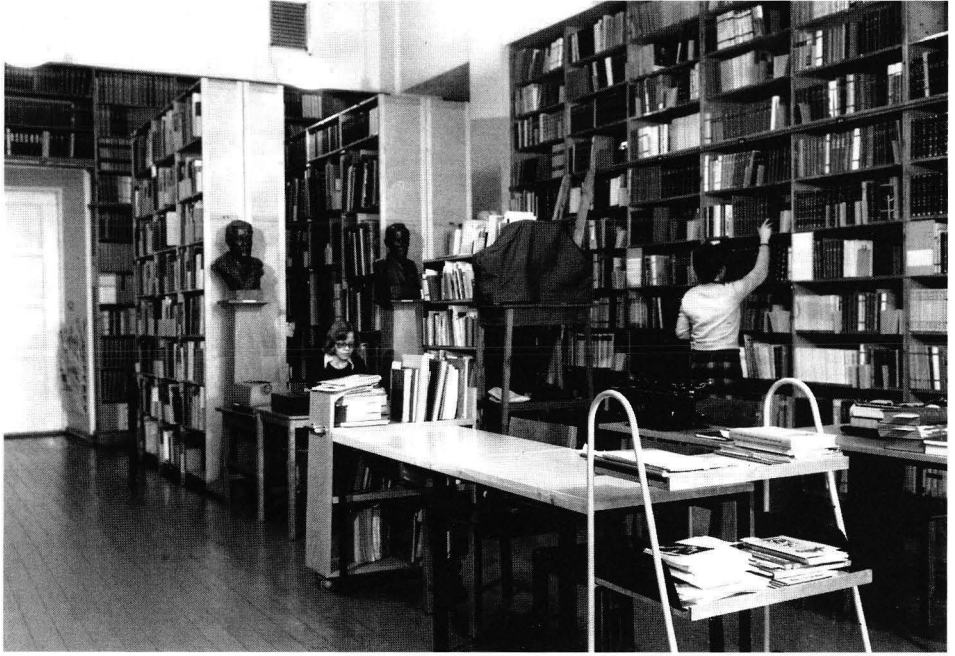
Kuva 1. Kirjastoapulainen Kyllikki Heikkinen (vas.) ja kirjastonhoitaja Kerttu Itkonen ehtivät tottua tilan- ahtauteen ja itseään yli kaksi kertaa korkeampiin hyllystöihin Kansallismuseon kirjastossa.

tojen suojelusta sekä mahdollisesti tulevaisuudessa perustettavan kansallismuseon hoidosta. Muinaistieteelliselle toimikunnalle kertyvät kokoelmat määrättiin ennen kansallismuseon perustamista sijoitettavaksi yliopiston historialliseen museoon. Virasto ei aluksi ollut kovinkaan huomattava: vakituista henkilökuntaa edusti valtionarkeologi yksinään. 10