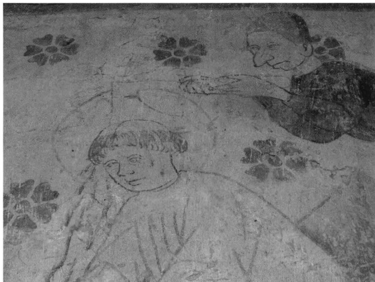
S:t Henrik och Lalli i Österunda kyrka. Pyhä Henrik ja Lalli Östersundin kirkossa.

mycket väl kände till Sankt Henriks legend eller dess folkliga version – de följde den troget.