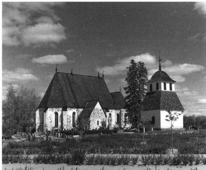
Nousis kyrka. Nousiaisten kirkko.

I slutet av 1200-talet framträder S:t Henriks kult i Åbo stift så starkt och förekommer i så många källor, att det bakom detta otvivelaktigt redan ligger en längre utveckling. Utarbetandet av den latinska legenden sker under de sista decennierna av 1200-talet.