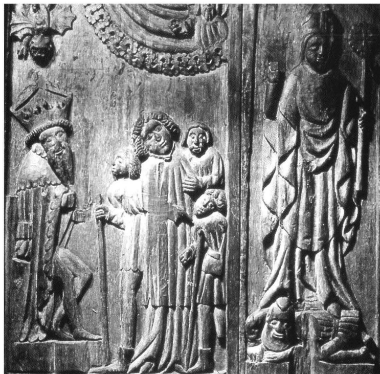
S:t Henrik i Myllymäki kyrka. Pyhä Henrik Myllymäen kirkossa.

Många detaljer i samband med Henrikskulten har ända fram till idag varit ett terra incognita . Då man kartlade och samlade de bevarade medeltida bilderna, skulpturerna och altarskåpsmålningarna samt kyrkornas kalkmålningar inom samma pärmar först 850 år efter hans antagna Finlandsfärd, 101 finner man till exempel att det ganska digra, bevarade bildmaterialet på den nuvarande svenska sidan av riket varit närapå okartlagt och oanvänt av forskarna. Detsamma gäller den för kulturn väsentliga