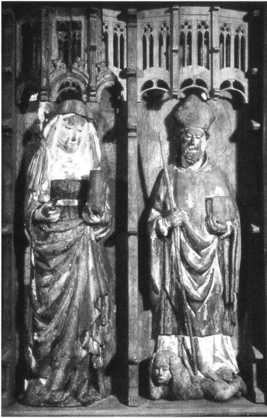
Heliga Birgitta och S:t Henrik avbildade i altarskåpet i Brändö kyrka.

Pyhä Birgitta ja Pyhä Henrik kuvattuina Brändön kirkon alttarikaapissa.