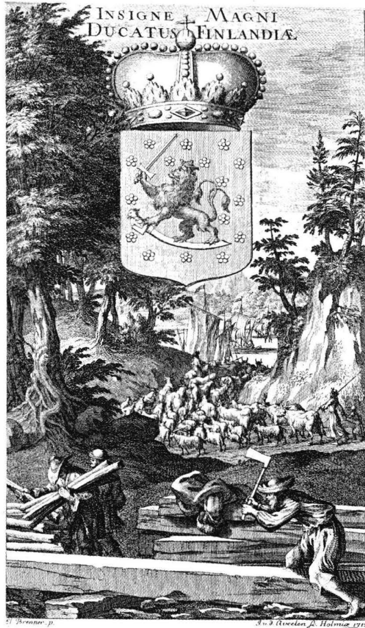
Kuva 2. Elias Brennerin piirtämä Suomen suuriruhtinaskunnan vaakuna teoksesta Svecia antiqua et hodierna . J. van den Aveelenin kuparipiirros vuodelta 1712.

maisemavaakunoiden suunnittelulle: kirja oli saatava valmiiksi eikä ollut enää mahdollista matkustaa ja hankkia paikan päällä tehtyjä piirustuksia Suomen tai edes Ruotsin maakunnista. Suuri pohjan sota jatkui, Viipuri oli menetetty 1710, ja 1713 venäläiset olivat valloittaneet jo koko Etelä-Suomen. Se, mitä maakunnista haluttiin kertoa, oli piirrettävä kuvitteellisena, tyypillisenä maisemana vaakunoiden yhteyteen. Hämeen vaakunan hylkäämisen syynä saattaisi olla se, että Hämeestä kuitenkin oli jo olemassa hieno Hämeen linnan kaksoiskuva, useimmista Suomen maakunnista ei vielä mitään. Brenner tähtäsi alueelliseen kattavuuteen.