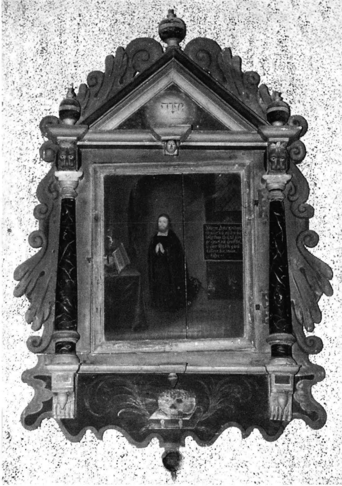
Kuva 2. Petrus Ingemar (1593–1681) puinen epitafikaappi Tenholan kirkossa. Muotokuvan on signeerannut Jochim Kröger.