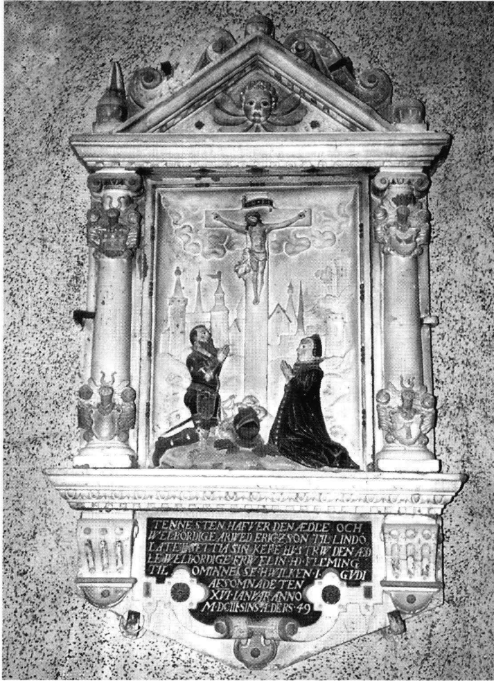
Kuva 1. Elin Flemingin (1553–1603) kalkkikivistä veistetty epitafi Tenholan kirkossa.

Tenholan keskiaikaisen kirkon sakaristossa on kaksi epitafia, joissa molemmissa on hallitsevana arkkitehtoninen rakenne: kuva-alueita reunustavat pylväät ja ylhäällä on frontoni. Tyylillisesti epitafit poikkeavat toisistaan: Elin Flemingin 1600-luvun alussa kalkkikivistä veistetty renessanssityylinen epitafi (kuva 1) edustaa mahtipontisuudessaan aatelin tyyl-ihanteita, kun taas kirkkoherra Petrus Ingemarinen epitafi (kuva 2) 1600-luvun loppupuolelta on mystisromanttinen barokin edustaja.