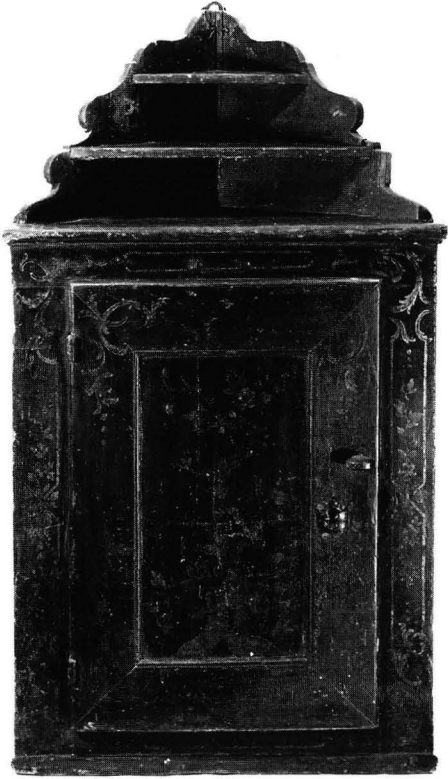
Kuva 1. Nurkkakaappi, myöhäisbarokkia, 1700-luvun puoliväli. Peräisin Taivassalosta. Maalattu mustaksi, koristelu kullalla. Kork. 98 cm. Kansallismuseo, inv. 34009.