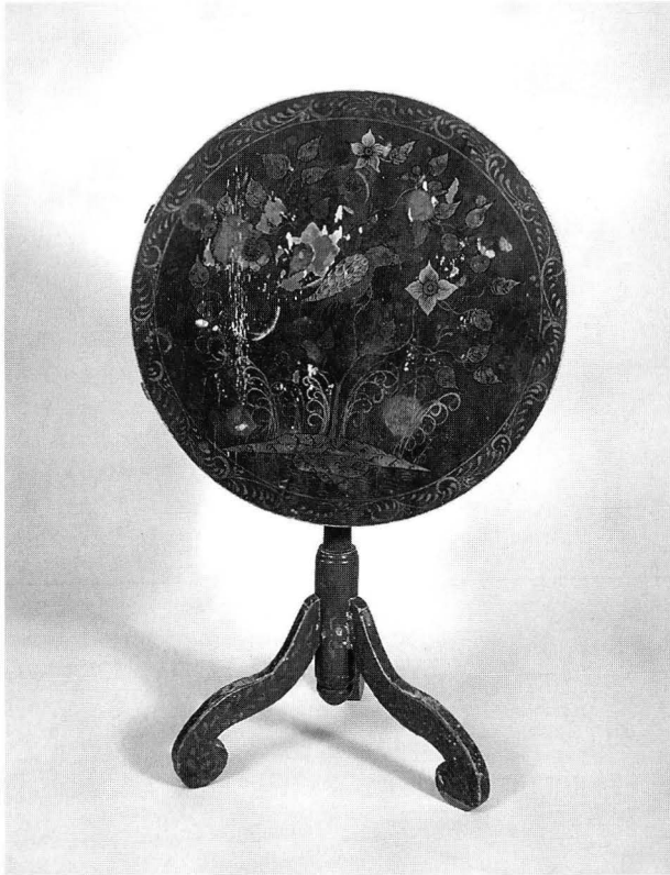
Kuva 3. Teepöytä 1760-luvulta, todennäköisesti turkulaista työtä. Peräisin Paraisilta. Maalattu siniseksi, koristelu kullalla ja hopealla. Levyn halk. 63 cm. Kansallismuseo, inv. 95009. Valok. ennen konservointia.

maakumpare ja siltä kasvavat, kihartuvat heinät ja hento puu kukkineen sekä puussa istuva lintu ovat saman mallin mukaan maalattuja. Kaapin pohjaväri on vaalean keltävä; lintu, lehdet ja kukat on maalattu hopealla ja kullalla. Pöydän väri on rokokooajalle tyypillinen tumma sininen ja levyn koristelu on maalattu kullalla ja hopealla kuten kaapissakin. Myös pöydän reunaa kiertävä ja kaapin ovenpielissä oleva koristelu on samanlainen. Teepöydän jalka on myöhäisbarokkia mutta levy poikkeuksellisesti pyöreä. Rymättylästä tunnetaan lisäksi yksi myöhäisbarokkityyppinen, punainen teepöytä, jonka kiinalaisaiheinen koristelu on maalattu kullalla ja hopealla. 23