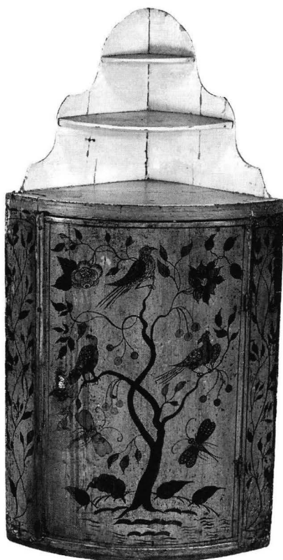
Kuva 4. Nurkkakaappi 1760-luvulta, todennäköisesti turkulaista työtä. Kellertävänvihreä pohjaväri, koristelu ruskeansävyinen. Kork. 93 cm. Kansallismuseo, inv. 41001:873 (Bergmanin kokoelma).