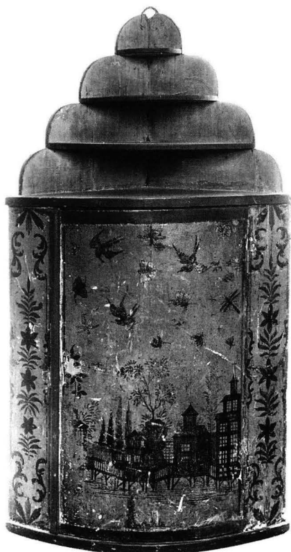
Kuva 6. Nurkkakaappi 1760-luvulta, todennäköisesti turkulaista työtä. Peräisin Hammarlandista. Maalattu vaalean kellan vihertäväksi, koristelu mustalla. Kork. 114 cm. Kansallismuseo, inv. 40026.

Varsinais-Suomesta (Hammarland, KM 40026 24 , kuva 6; Turku? yksit. om.) on peräisin kaksi nurkkakaappia, joissa on tyylitellen esitetty kaupunkimaisema. Molemmissa kaapeissa kaupunki näyttää paalujen päälle rakennetulta; talot ovat erikokoisia, vailla perspektiiviä ja erityisesti laidoilla olevat talot ovat suurikokoisilla ikkunoilla varustetut. Mielestäni on ilmeistä, että rakennukset pohjautuvat lähteestä toiseen kopioituun malliin, jolloin arkkitehtoninen totuudenmukaisuus on vähitellen kadonnut; »paalutus» lienee alkuaan tarkoittanut jonkinlaista aitaa. Samalla nämä rakennukset eivät enää esitä »kiinalaista» arkkitehtuuria: ne ovat yksinomaan tyypologisesti surkastuneita. Kuvan keskellä, rakennusten takana, nousee kallio, joka toisessa kaapissa on muuttunut kookkaiksi kukka-aiheiksi, joilta kasvaa ohutvartinen puu. Taivaalle on kuvattu lintuja ja erilaisia hyönteisiä, mm. perhosia. Molempien kaappien reunojen ornamenttiikka on samankaltainen. Arkkitehtuuri sekä lentävät linnut ja perhoset ovat yksityiskohtia, jotka ovat verrattavissa Stalkerin ja Parkerin mallikuviin (kuva 7). On kuitenkin luultavaa, että 1700-luvun jälkipuolelle tultaessa Stalkerilta ja Parkerilta