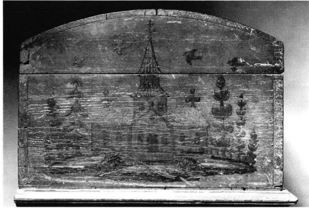
Kuva 9. Yölipaan pääty. Lipkaan kannen sisäpuolella nimikirjaimet A:M:H: ja vuosiluku 1765. Alkuperä tuntematon. Maalattu vihreäksi, koristelu kullalla. Lev. 50 cm. Kansallismuseo, inv. 37100:29.