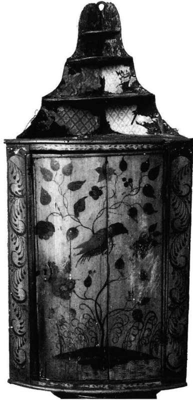
Kuva 2. Nurkkakaappi 1760-luvulta, todennäköisesti turkulaista työtä. Peräisin Turusta. Maalattu kellertäväksi, koristelu kullalla ja hopealla. Kork. 104 cm. Kansallismuseo, inv. 7167:1 (Antellin kokoelmat).

Mitkä piirteet yhdistävät Turun seudun kaappeja? Koko kaarevan etuseinän korkeiseen oveen maalatussa koristelussa oleva hentovartinen puu kasvaa pieneltä maakumpareelta. Oksat kiemurtelevat eri suuntiin ja niistä kasvaa suurikokoisia lehtiä ja kukkia. Maakumpareen alapuolelle on maalattu pieniä aaltoviivoja ja kumpareta muodoltaan muistuttava alue, joiden tarkoituksena saattaa olla kuvata veteen heijastuvaa maata. Linnut, joita on yksi tai kolme, muistuttavat toisiaan: pyöreät päät ja suuret, tuijottavat silmät, koukkumainen nokka, pitkät ja terävät pyrstösulat. Sulkien kuvaus erityisesti siivissä on kaavamaisista.