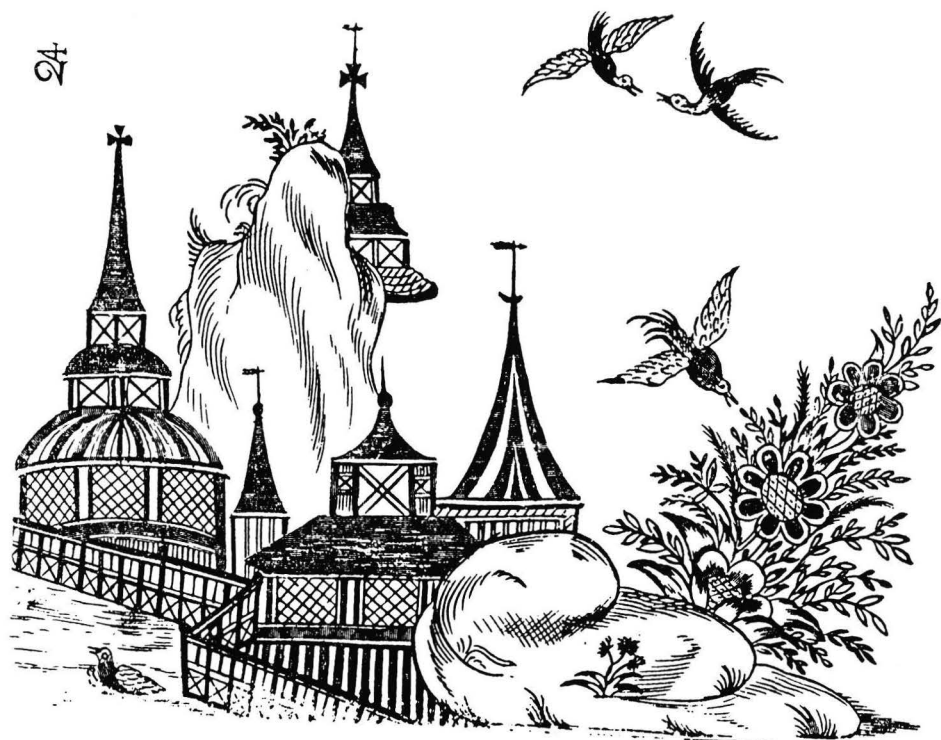
Kuva 7. John Stalker-George Parker, A Treatise of Japanning and Varnishing , 1688. Mallikuva n:o 24.

periytyvä kuvamaailma ja koristetyypit ovat olleet jo niin vakiintuneita ja yleisiä, ettei suoranaista kirjaan perustuvaa syy-seuraussuhdetta voida enää esittää tai pitää edes luultavana. Toisen kaapin vaalean kellanvihreä taustaväri on melko lähellä lintukoristeisten kaappien kellertäviä ja vihertäviä pohjavärejä. Toinen kaappi on tummanvihreä ja tässä yhteydessä kannattaa muistaa yölipas vuodelta 1765, joka sekin on väritään voimakkaan vihreä (ks. s. 80).