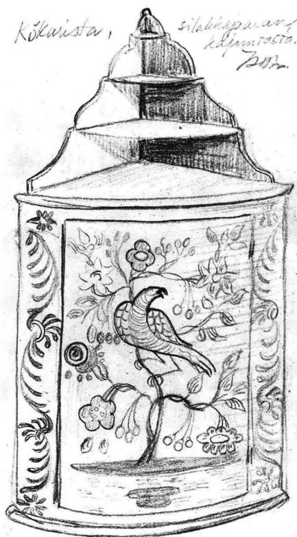
Kuva 5. Nurkkakaappi »Kökarista, silkkijaalan kajuutasta», 1760-luvun turkulaista tyyppiä. Hannes Maliston piirroksen perusteella. Museovirasto.

tunt., KM 41001:873, kuva 4; Finström, Ålands museum, 17/1905) heinien paikalla on neljä suurikokoista lehteä symmetrisesti puun juurelle aseteltuna. Kukkien lisäksi puiden oksilta riippuu pyöreitä marjoja kantavia terttuja: neljä terttua, kussakin kolme marjaa. Kökarista peräisin oleva kaappi, joka tunnetaan ilmeisesti ainoastaan Hannes Maliston piirroksen perusteella (kuva 5), on samaa marjaterttuja kantavaa mallia, mutta lintuja on vain yksi, samaa tyyppiä kuin muissa viime mainituissa kaapeissa. Jomalasta on peräisin kaappi, jossa on yksi lintu sekä samoin kuin kaapissa KM 41001:873 kaksi sudenkorentoa (Ålands museum, 326/1935). Kolmen linnun kaapeissa kuvatut, puun juurella kasvavat heinät yhdistävät nämä kaapit ensiksi mainittuun kaappi-teepöytä-ryhmään; kaikki kolmilintuiset kaapit taas kuuluvat samaan ryhmään kokonaisuusmitelmansa samankaltaisuuden perusteella.