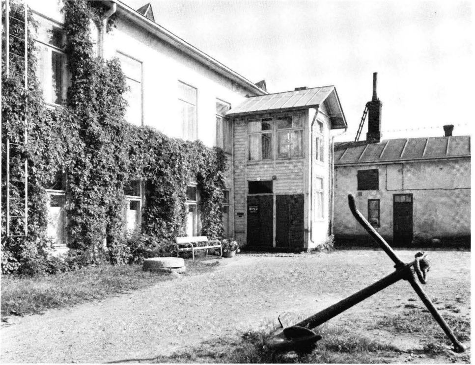
Kuva 2. Satakunnan Museo sijaitsi ns. Iltaman talossa vuosina 1903—1973.