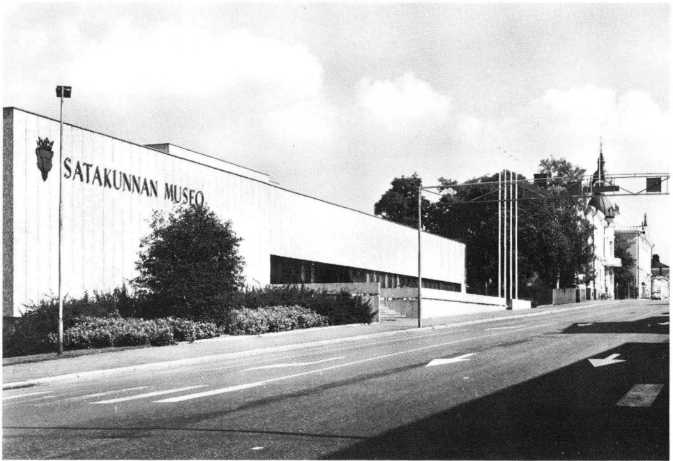
Kuva 3. Vuonna 1973 valmistui museon nykyinen rakennus, suunnittelijana arkkitehtitoimisto Olaf Küttner Ky.

rastona toimivan Liinaharjan kartanon entisen navettarakennuksen 765 m 2 . Viimeksimainitussa on myös viime vuosina voitu tehdä kunnostustöitä, jotka kohentavat ko. varaston käyttökelpoisuutta huomattavasti. Museolla on siis tarpeisiinsa käytävissä nykyisin n. 6100 m 2 tiloja.