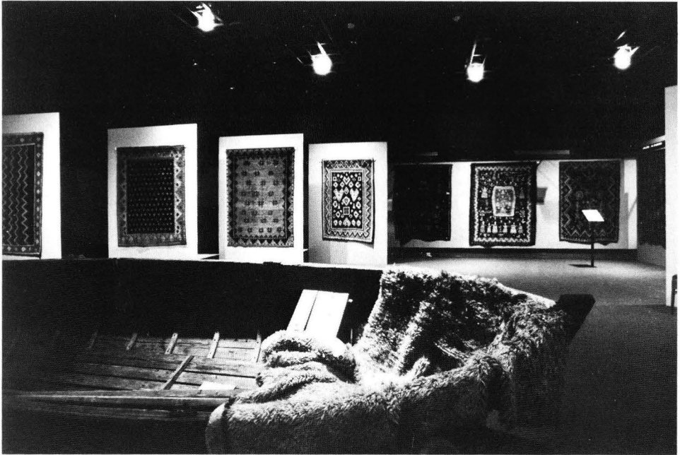
Kuva 5. Museon nykyistä tilapäisnäyttelytilaa ja sinne sijoitettua riijynäyttelyä.

takin on selvää, että niin perusnäyttelyn kuin tilapäisnäyttelyidenkin asiallisen toteutuksen yksi perustekijöistä on se, että museolla on näihin tarkoituksiin soveltuvat tilat. Tällaisia tiloja Satakunnan Museo hankki itselleen ponnekkaasti vuodesta 1888 vuoteen 1973 saakka. Puutteellisista tiloista huolimatta tilapäisnäyttelytoiminta aloitettiin tai siitä on ainakin ensimmäinen varma tieto vuodelta 1942, jolloin museolla oli yhdessä kirjaston kanssa kirjapainotaidon 300-vuotisnäyttely.