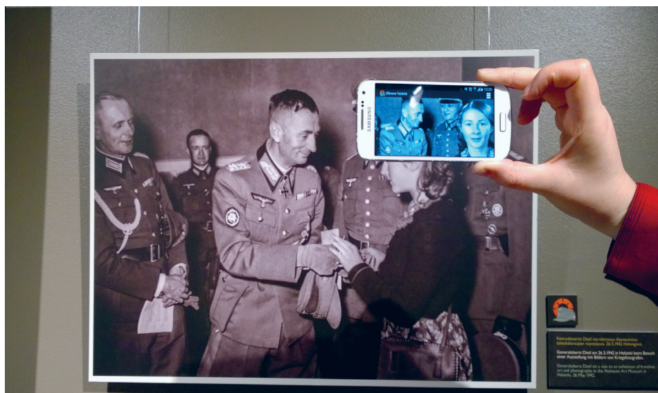
Kuva 4. Yksi lisätyn todellisuuden avulla dramatisoiduista valokuvista.