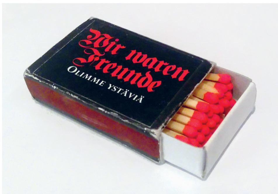
Kuva 2. Kielletystä markkinointikikasta keräilyharvinaisuudeksi: Wir waren Freunde -tulitikut.

sia. Vastausten laatu vaihteli kuitenkin paneutuneesta ja vuolaasta hyvin niukkaan. Osa vastauksista oli koululaisryhmien tuottamia, todennäköisesti opettajan kehoituksesta, ja joissain tapauksissa ulkomaalaiset vieraat olivat ymmärtäneet kyselyn koskevan koko Arktikumia sisältöjä. Havaitimme kyselylomakkeessamme jälkikäteen myös joitain puutteita: lomakkeen etupuolella ei esimerkiksi mainittu sen kaksipuolisuudesta. Tästä tai muista syistä, kuten kiireestä, johtuen yhdeksän prosenttia vastaajista jätti täyttämättä kääntöpuolen kysymykset.