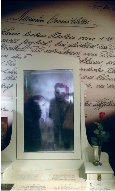
Kuva 1. Suomalaisnaisen ja saksalaissovitilaan rakkaustarina Wir waren Freunde -näyttelyssä.