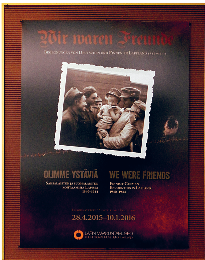
Kuva 3. Näyttelyn mainosjuliste (valokuva Oula Seitsonen 2015).

ja kertoi lyhyen tarinan kuvan esittämästä tilanteesta. 41 Näitä interaktiivisia kuvia pystyy tarkastelemaan sovelluksella myös näyttelyjulkaisun sivuilta. 42 Yksi kuvista liittyy julisteen tilanteeseen, jossa näytelty nuori saksalaisistilas kertoo kokemuksestaan Lapissa, toisessa kuvassa suomalaismies kertoo liiketoimistaan saksalaisen kanssa, ja kolmannessa nuori suomalaisnainen kuvailee innostustaan saatuaan kenraali Dietlin nimikirjoituksen (Kuva 4). Nämä hieman aavemaiset kuvat 43 ja niiden mahdollistama toiminnallisuus nousivat esiin myös kävijäkyselyssä näyttelyn mielenkiintoisimpana antina.