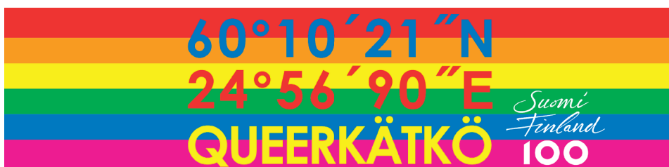
Kuva 1. Queerkätkö-teoksen Facebook-banneri.

meista poikkeavien, hyljeksittyjen ilmiöiden tunnistamista ja tunnustamista kulttuuriperinnöksi. Se johdattelee pohtimaan, miten ilmiöiden luokittelu kulttuuriperinnöksi vaikuttaa kohteisiinsa eli tässä tapauksessa toistenlaisten ja toisenlaisiin menneisyyden jälkiin. Kesyttääkö hyväntahtoiseksi tarkoitettu poikkeavan kulttuuriperinnöllinen vaaliminen sen yhdenmukaiseksi eli samanlaiseksi kuin kaiken muunkin kulttuuriperinnöksi luokitellun – ja viimein taloudelliseksi resurssiksi ja kulutettavaksi tuotteeksi?