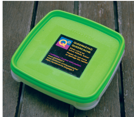
Kuva 3. Queerkätkön muovinen säiliö.

vastasivat Hamm ja Kamanger. Teos julkistettiin 26. kesäkuuta Helsingin kaupunginmuseossa, ja kätköt olivat maastossa 30. heinäkuuta 2017 saakka.