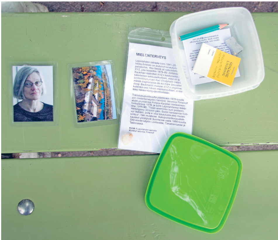
Kuva 5. Queerkätkön sisältö.

toisaalta vastustaa kulttuuriperinnöllistymisen yhdenmukaistamista, kansallistamista sekä heteronormatiivista puhetta yhteisöistä ja sukupolvista. Kätköjen muistot kertovat konflikteista ja kohtaamisista siellä, missä kaupunkitilassa oletetaan toista. Queerkätkön muoto korostaa tietämisen fyysisyyttä ja paikallisuutta, mutta samalla geokätköilyn toiminta on hetkellistä ja tiedollisesti pirstaleista. Häilyvyys rinnastuu kaupunkitilaan, jossa usein vain virallisesti kulttuuriperinnöllistetyllä on mahdollisuus säilyttää ajallinen ja aineellinen jatkuvuutensa.