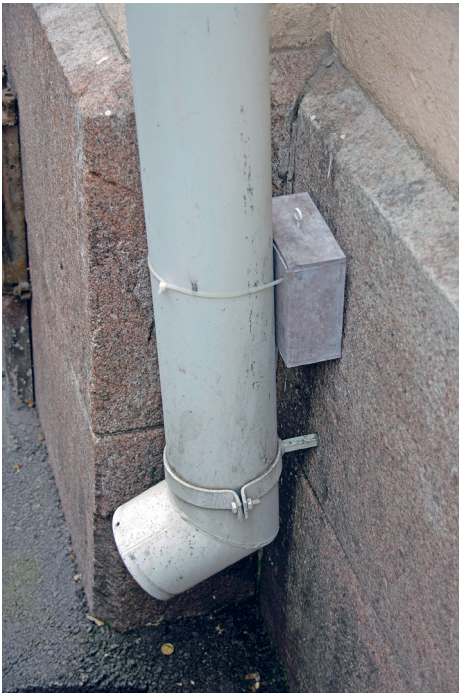
Kuva 2. Queerkätkön puinen laatikko piilotettuna rännin taakse.