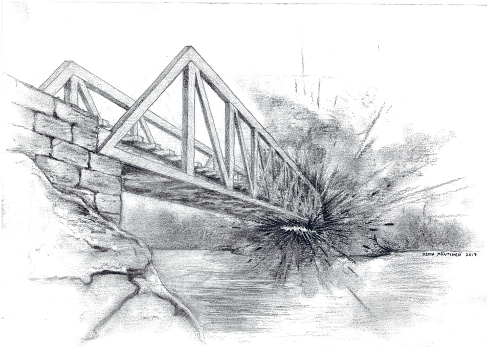
Kuva 3. Kiepin sillan räjäytys Mäntyharjussa helmikuussa 1918. Piirros Osmo Pöntinen 2017.