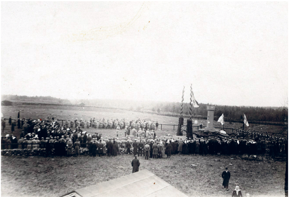
Kuva 7. Mouhun taisteluiden muistomerkin paljastus vuonna 1926. Kuva Mäntyharjun museo.