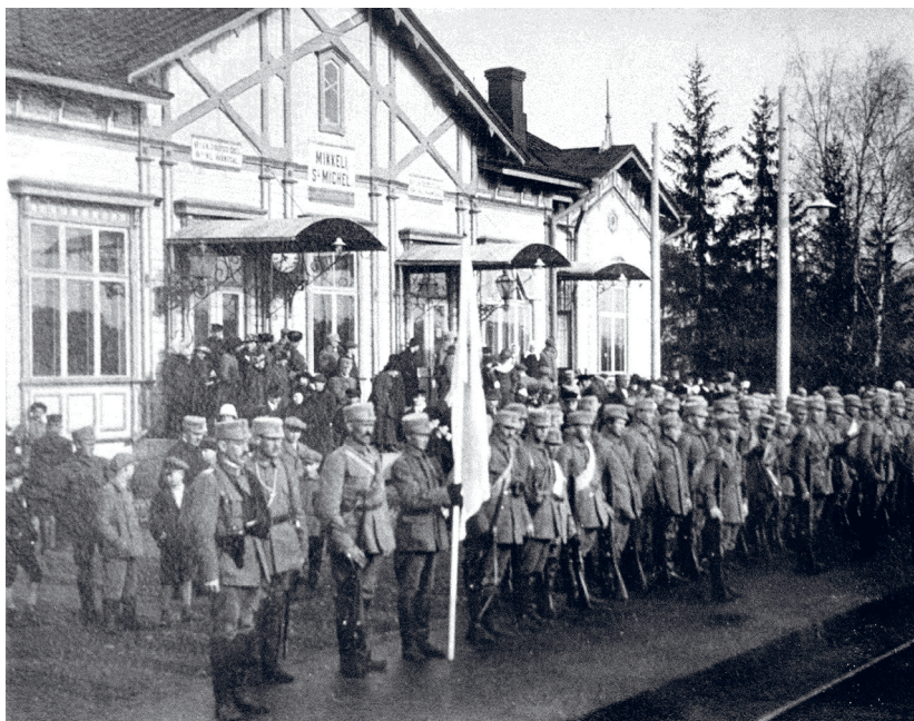
Kuva 8. Mäntyharjulaisia valkoisia Mikkelissä keväällä 1918.

Kuten tiedotetta kommentoinut lukija, myös museon järjestämällä luennolla osa yleisöstä käytti sodasta yleisesti nimitystä vapaussota. Termi kuitenkin särähti joidenkin muiden luennon kuulijoiden korvaan. Eräs osallistuja perusteli vapausotanimityksen vastaista kantaansa. Hänen mukaansa termi vapaussota sivuutti punaisen puolen muistot ja näkökulman sotaan.