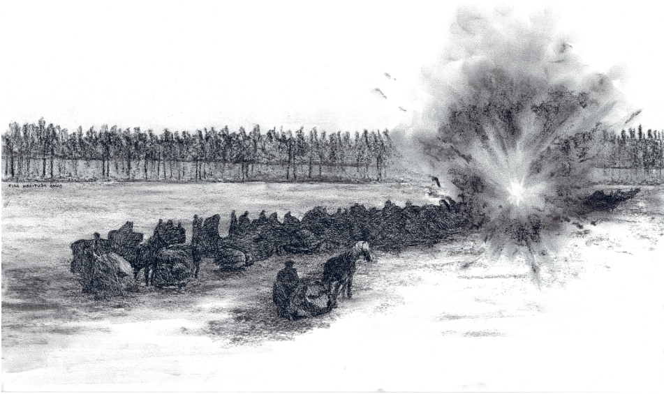
Kuva 4. Paljakanlahden räjähdys 3.3.1918. Piirros Osmo Pöntinen 2017.