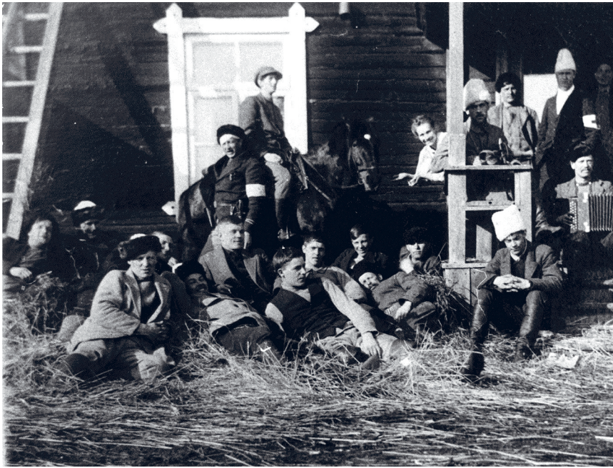
Kuva 2. Valkoisia Penttilän talon rappusilla Mäntyharjussa keväällä 1918.