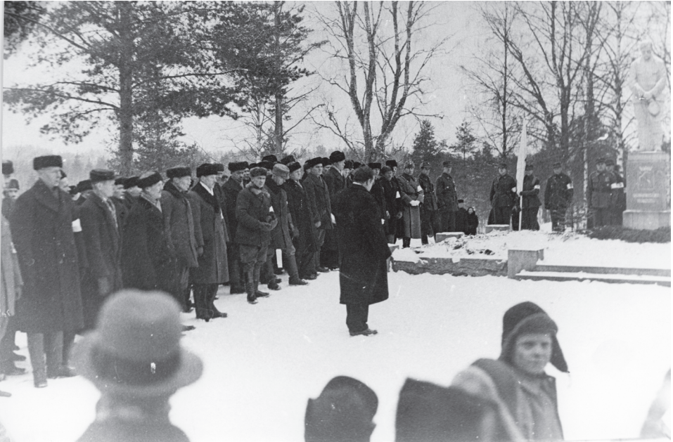
Kuva 6. Valkoisten muistomerkin paljastus.