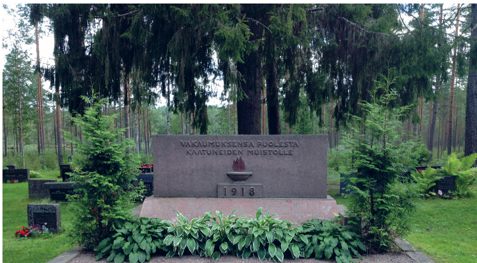
Kuva 9. Vuonna 1949 Mäntyharjun hautausmaalle pystytetty punaisten muistomerkki elokuussa 2016.

aiheuttavan usein kiukkua. Vastaavasti toisen mielestä yleisenä totuutena esitetty näkökulma voi tuntua loukkaavalta. 44