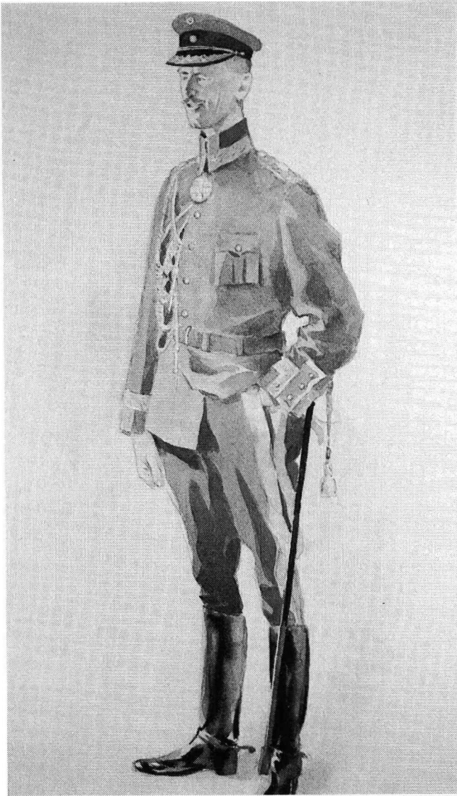
Oscar Paul Enckell Hugo Backmanssonin akvarelli (Pääesikunnan päällikön virkahuoneessa)

18. 9.24 asti, jolloin sai omasta pyynnöstään eron ja siirrettiin reserviin kenraaliluutnanttina, ”oikeudella käyttää sotilasvirkapukua”, kuten tuolloin oli tapana määrätä. 3