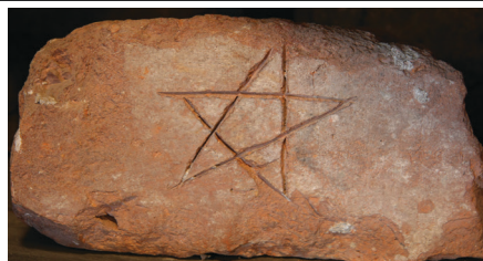
Bild 6. Pentagrammet i förrådet och korväggen.