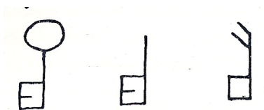
Bild 5. Nyckelmärken från korväggen. Finns i Pojo, Karis, Kimito, Lundo och Rusko kyrkor. 1941