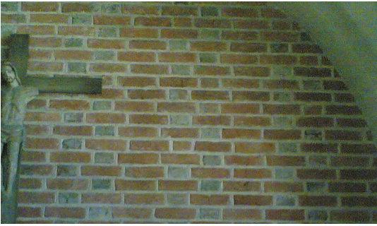
Bild 1. Borgmästarkapellet med mörkgröna tegelkoppar. Stenlund 2015.