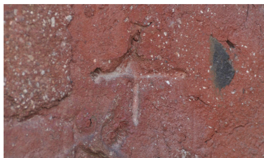
Bild 3. Likarmat kors/passmärke vid sakristians yttervägg. Stenlund 2015.