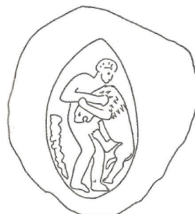
Kuva 6. Sinetinpainallus, Wadi Daliya, myöhäinen persialaisaika (375–335). Strawn 2005, fig. 3.116.

Juudassakin tunnettua assyrialaista kuninkaallista sinettiaihetta, jossa kuningas puukottaa takajaloillaan seisovaa leijonaa (kuva 3).