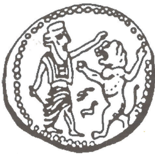
Kuva 2. Kolikko, Samaria, rautakausi III / persialaisaika. Strawn 2005, fig. 3.143.