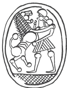
Kuva 5. Skarabi, Askelon, persialaisaika (6. – 4. vuosisata eaa.) Keel 1997, Aschkelon no. 59.