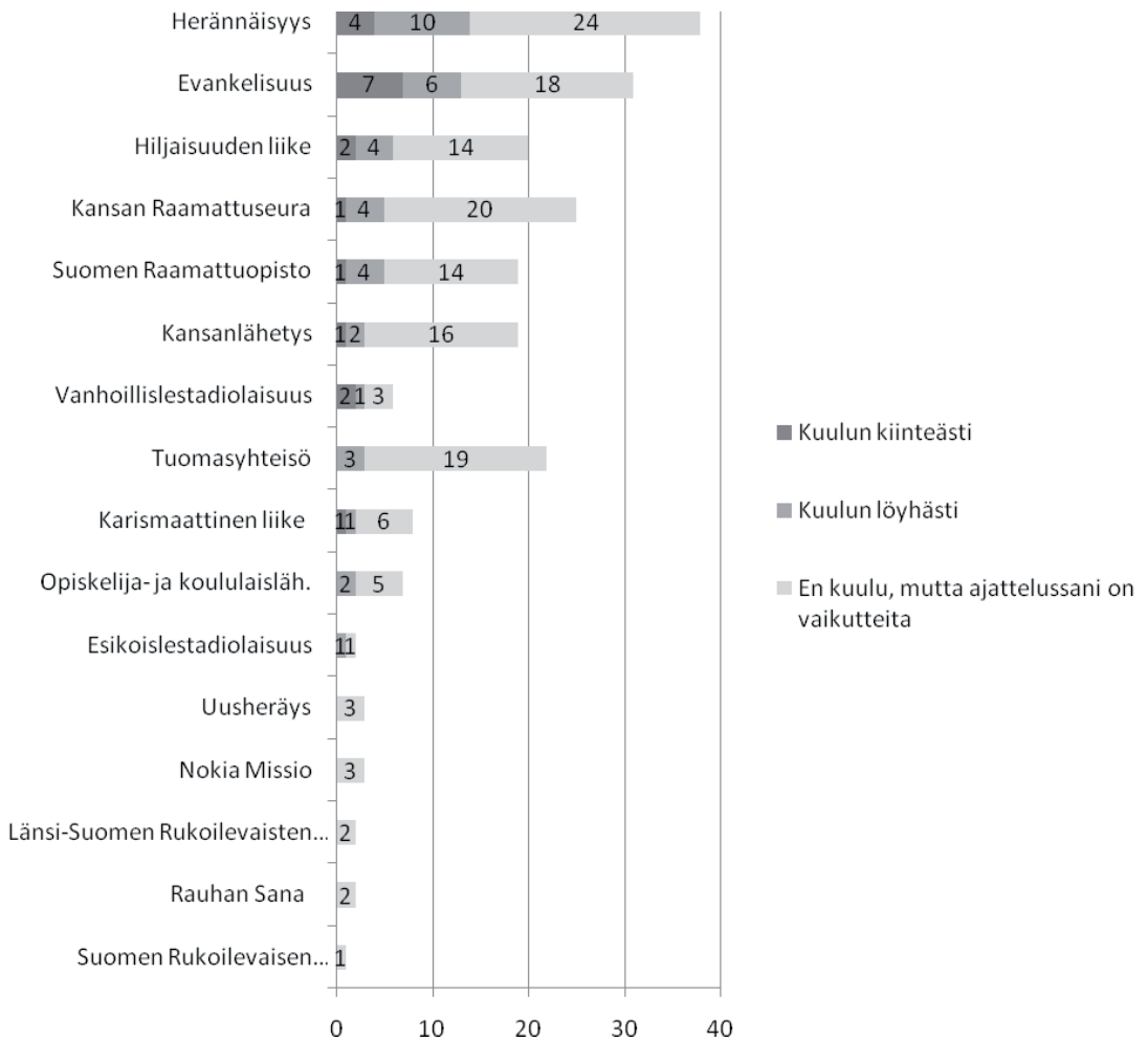
Kuvio 2. Kirkon työntekijöiden sitoutuminen herätysliikkeisiin ja kristillisiin järjestöihin 2009 (N=690). (%).

sityöntekijät ja -ohjaajat, joista kukaan ei kuulunut herätysliikkeen järjestöön tai säätiöön. Muodollisessa sitoutumisessa ei eri ikäryhmien välillä ollut erityisen suuria eroja: vanhimmista ikäryhmistä järjestöihin kuului 17 prosenttia, mutta nuorimmistakin (alle 30-vuotiaista) 13 prosenttia.