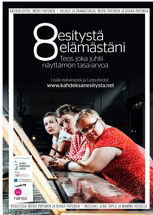
Kuva 3. 8 esitystä elämästäni -esityksen juliste. Julisteen graafinen suunnittelu: Asmo Raimoaho. Julisteen kuva: Risto Kuittinen.

Julisteen reunoilta löytyvät tekijöiden nimet sekä esitystä tukeneet tahot.