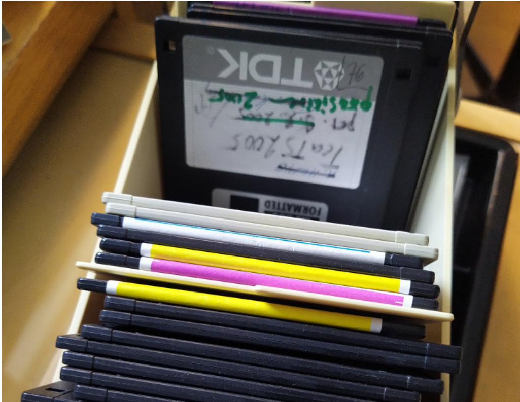
Kuva 2. Lerppujen jälkeen tulivat korput. USB-muistitikkujen aika oli juuri koittamassa.