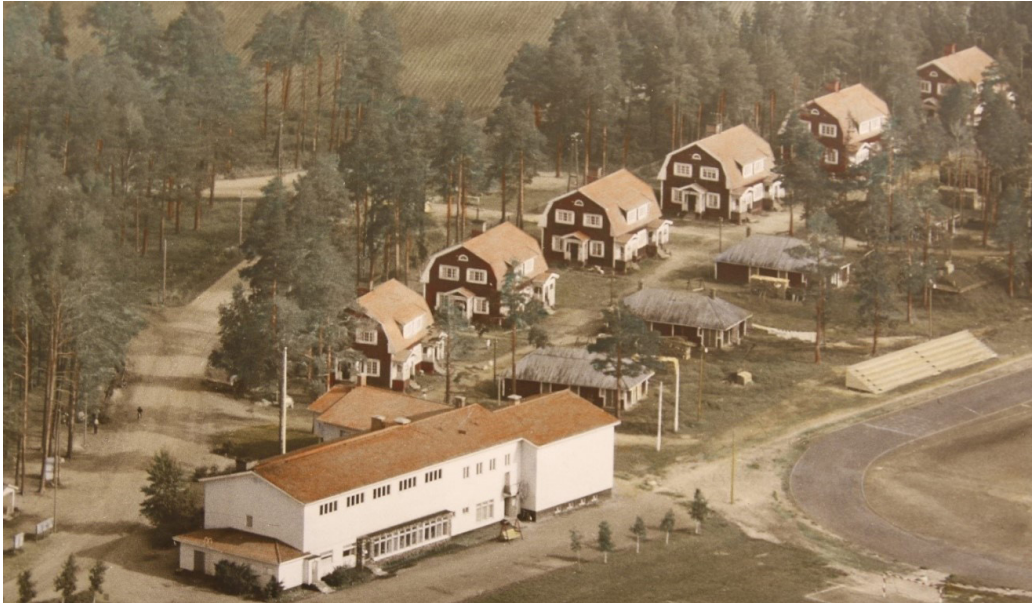
Kuva 11. Kuvassa 1950-luvulla Pateniementien varrella kuusi Porilan taloa varastorakennuksineen. Etualalla yhteisötalo Honkapirtti.

le rakennetut talot, muodostivat oman pienen yhteisönsä (kuva 11). Porilan talot käsittivät kuusi rakennusta, joissa jokaisessa oli neljä kahden huoneen asuntoa. Perhekoot olivat suuria ja yhdessä perheessä saattoi olla jopa seitsemän lasta: