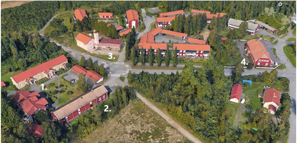
Kuva 14. Sahantien varrella sijaitsevat: 1) entiset sahan konttorirakennukset, keltainen ja punainen; 2) entinen verstarakennus Nikkaripirtti; 3) vuonna 1951 valmistunut paloasema sekä 4) sahan entinen ruokalarakennus.

Sahan lopettamisen jälkeen alueelle jäi kuitenkin sahanaikaisia rakennuksia, joiden elinkaari on jatkunut saha-ajan päätyttyä. Edellä mainittujen Honkapirtin ja Porilan talojen lisäksi sahan entiset konttori- ja verstarakennukset, ruokalarakennus sekä entinen paloasema ovat edelleen paikoillaan (kuva 14). Suurin muutos näiden rakennusten kohdalla on niiden käyttötarkoituksessa tapahtuneet muutokset. Entiset konttorirakennukset ovat nykyisin yksityisomistuksessa olevia asuinrakennuksia. Entinen verstarakennus, Nikkaripirtti, on Pohjois-Pohjanmaan museon ylläpitämänä sahan museona, paloasema on muuttunut asuin- ja varastorakennukseksi ja sahan entinen ruokalarakennus on niin ikään asuinkäytössä. Vaikka rakennukset eivät enää ole niiden alkuperäisessä käytössä, kertovat ne omalta osaltaan saha-ajan historiasta. Näissä rakennuksissa asuu henkilöitä, joilla on kiinnostus alueen historiaan ja sahan aikaisen kulttuuriperinnön vaalimiseen. 77