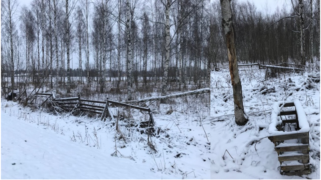
Kuva 9. Vuonna 2020 otetuissa kuvissa navettarakennuksen aitarakenteita sekä eläinten syöttökaukalo tyhjän tontin takana olevassa metsikössä. Oikeanpuoleisessa kuvassa kaukalon vieressä olevassa puussa näkyvissä palojälkiä.