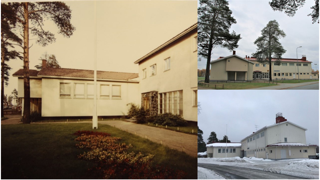
Kuva 10. (1) Kuvassa vasemmalla Honkapirtti 1960–1970-luvulla. (2) Ylhäällä oikealla Honkapirtti vuonna 2017. Samat männyt näkyvät edelleen rakennuksen edessä. (3) Oikealla alhaalla Honkapirtti vuonna 2020. Männyistä toinen on hävinnyt, mutta rakennuksen ulkoasu on pysynyt lähes muuttumattomana.

-- ja siellä oli se teatteriesitys ja ne oli aivan, määhän siis vieläki tuntuu, että määhän aivan haltioissani, ku määhän sain ensimmäisen kontaktin niiku teatteriin nii Honkapirtin kautta. -- Ja jotenki nautin siellä niistä kullisseista ja niistä penkeistä --. 61