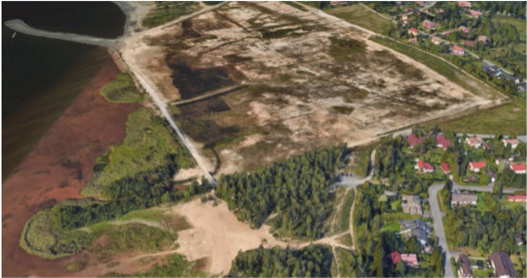
Kuva 4. Esiintymislavan aluetta vuonna 2017.