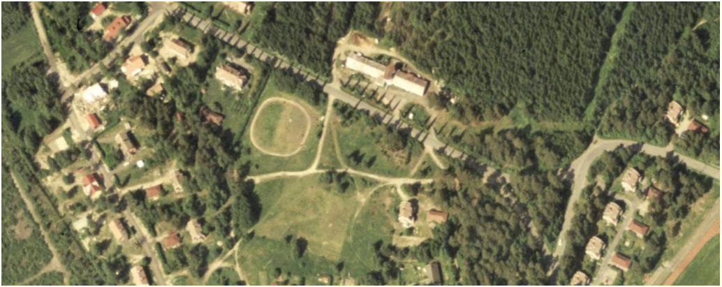
Kuva 6. Vuoden 1999 kuvassa saunarakennukset on purettu, mutta navettarakennus on edelleen pystyssä.