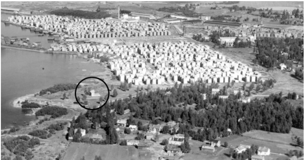
Kuva 3. Kesäjuhlien uusi esiintymislava ympyröitynä rannan ja tapulitarhojen läheisyydessä.