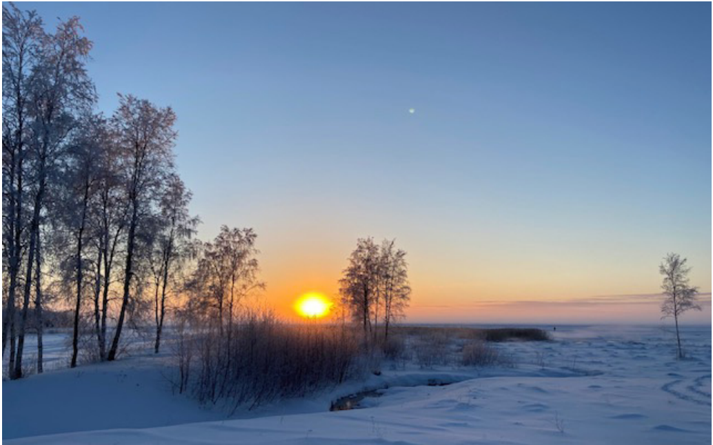
Kuva 17. Pateniemen rantaa talvisessa auringonlaskussa. Monelle ulkoilijalle ranta on väylä merelle, jäälle sekä lähisaariin.

Siitä huolimatta, että muistoista tutut paikat ovat osittain hävinneet, voi Pateniemessä aistia edelleen saha-ajan historian läsnäolon. Vaikka jäljelle jääneiden entisten sahanaikaisten rakennusten käytössä on tapahtunut muutoksia, ovat ne silti tärkeä osa alueen historiaa ja paikallisidentiteettiä. Vaikka entiset teollisuuskohteet ovatkin nykyään yhä kasvavien rakennuspaineiden alla, toimii alueen pysyvyys asukkaiden identiteetin tukipilarina.