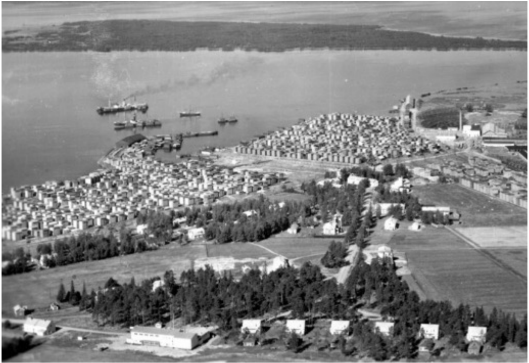
Kuva 2. Yleisnäkymää Pateniemen sahan alueelta 1950–1960-luvulla. Oikeassa yläkulmassa saha ja rantaviivaa seuraavat tapulitarhat. Etualalla yhteisötila Honkapirtti sekä kuusi Porilan asuintaloa.