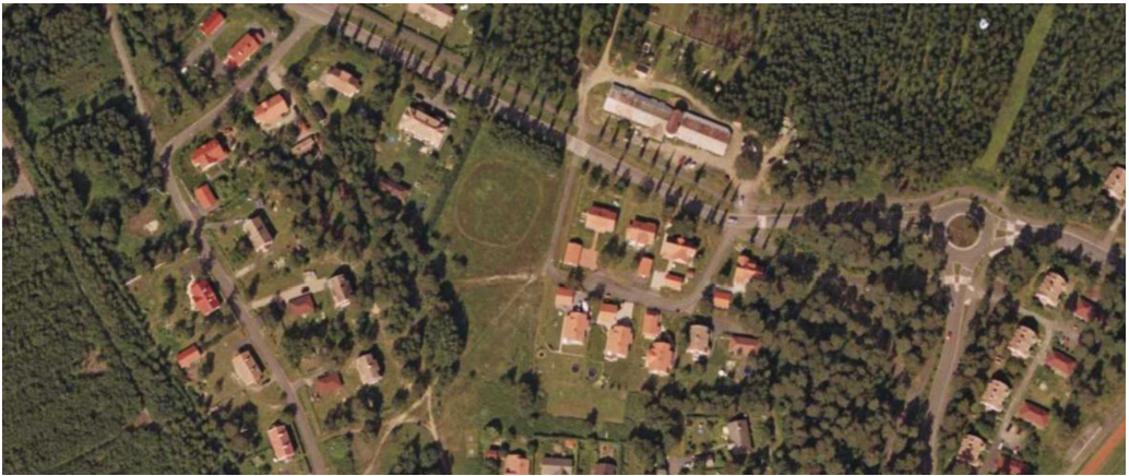
Kuva 7. Vuoden 2009 kuvassa saunan paikalle rakennettuja asuintaloja-, sekä Sahantien varressa olevat navettarakennukset.