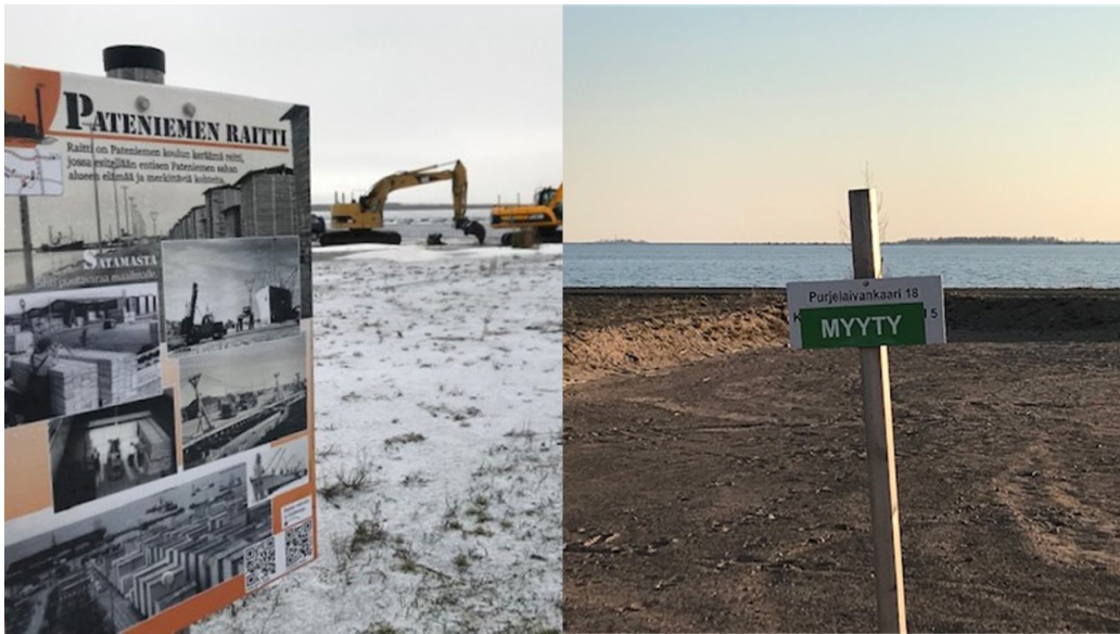
Kuva 13. Vuonna 2019 uudella asuinalueella rakennustyöt on aloitettu. Vasemmalla etualalla Pateniemen koulun Pateniemen Raitti -kyltti kertomassa alueen historiasta. Oikealla kuvassa vuonna 2020 näkyvä tontti on myyty.

Sahateollisuuden sivutuotteena maaperään on vuosien saatossa päässyt maaperää pilaavia kemikaaleja. Pateniemen sahalla käsiteltiin vuosina 1949–1984 Ky-5 valmistetta, jolla estettiin sahatavaran sinistymistä. Epäpuhtautena aineessa oli dioksiineja sekä furaneja. Vuosien 1952–1990 aikana sahalla käytettiin arseenia, kromia ja kuparia sisältänyttä kyllästysainetta K33. Maaperää puhdistettiin viranomaisten valvonnassa 1990-luvun lopulla sekä 2010-luvun aikana noin 30 hehtaarin laajuudelta. 69 Teollisuuden ympäristövaikutukset ovat askarruttaneet alueiden asukkaita myös muiden entisten teollisuuskohteiden, kuten Orijärven vanhan kupari-, rauta- ja kultakaivoksen yhteydessä. 70 Pateniemessä on maaperän puhdistamisen lisäksi suoritettu arkeologinen vedenalaisinventointi, jonka avulla kartoitettiin mahdolliset veden alle jääneet kulttuurikerrokset. 71