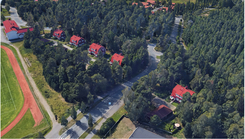
Kuva 12. Vuoden 2017 kuvassa viisi Porilan taloa. Yksi taloista purettiin 1970-luvulla uuden tien alta. Vasemmassa yläkulmassa yhteisötalo Honkapirtti.

Edellinen muisto kuvaa hyvin Porilanpihan yhteisöllisyyttä. Naapurit olivat tuttuja ja heihin pystyi luottamaan. 66 Uusi aikakausi koitti talojen historiassa, kun yhtiö möi ne Insinöörityö Oy:lle, jonka toimesta talot peruskorjattiin vuosien 1984–1985 aikana. Tämän jälkeen talot siirtyivät yksityisomistukseen. 67