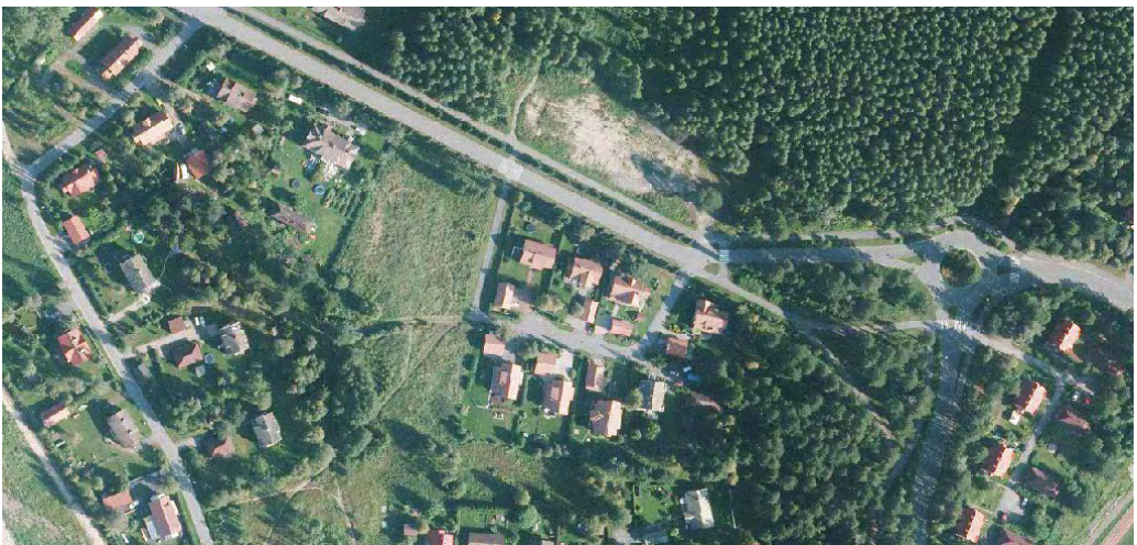
Kuva 8. Vuoden 2012 kuvassa saunan paikalle rakennetut asuintalot, joiden yläpuolella Sahantien varressa vuonna 2011 palaneen navettarakennuksen tyhjä tontti.