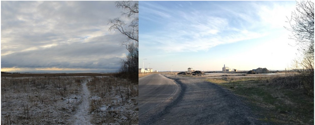
Kuva 16. Vasemmalla vuoden 2016 näkymä rannan suuntaan ja oikealla samasta paikasta näkymä vuonna 2020. Ennen koiranulkoiluttajien ja ulkoilijoiden suosima polku on muuttunut valopylväiden reunustamaksi auto- ja pyörätieksi. Uusia asuntoja on noussut horisonttiin.

Alueen asukkaat ovat saaneet seurata asuinalueensa muutosta lähietäisyydeltä; miten maiseman lisäksi uusien asukkaiden saapumisen myötä on muuttunut myös alueen väestö. Muuttoliike alueelle on ollut sahan loppumisen jälkeen negatiivista, mutta uuden kaavoituksen myötä se on lähtenyt kääntymään positiiviseksi. Millaiseksi entisen sahan alue muodostuu, kun suunniteltu asemakaava on valmis? Tähän tulee varmasti vaikuttamaan se, miten entiset ja uudet asukkaat löytävät yhteisen sävelen. Tiiviin rakentamisen myötä saha-aikaan vallinnut yhteisöllisyys voi saada uuden mahdollisuuden.