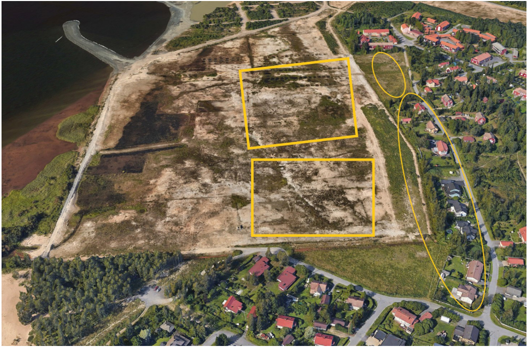
Kuva 15. Keltaisella ympyröityneenä Tokantien varrella olevat entiset rantanäkymän varustetut talot. Tokantien ja meren väliin rakentumassa olevat Pantturipihan alueet neliöiden sisällä, jotka tulevat peittämään vanhojen talojen merinäkömän.

ja mitähän kaikkia arvauksia sitä tässä nyt onkaan, mutta että... aika palijohan sinne vissiin tulee asujia, että liekö se sitte taas tois tämmöstä uutta viriämistä ja toimintaa sitte, että liekö tämä ois vaikea, että tätä aluetta sitte täytyy ehkä kehittääki entisestään siitä jobosta sitte. Saa nähä... saa nähä, mutta että nyt jotenki sitte huomannu, että ehkäpä Pateniemi on sillä lailla aika viriää ja järjestäytyntä aluetta kuitenkin. 79