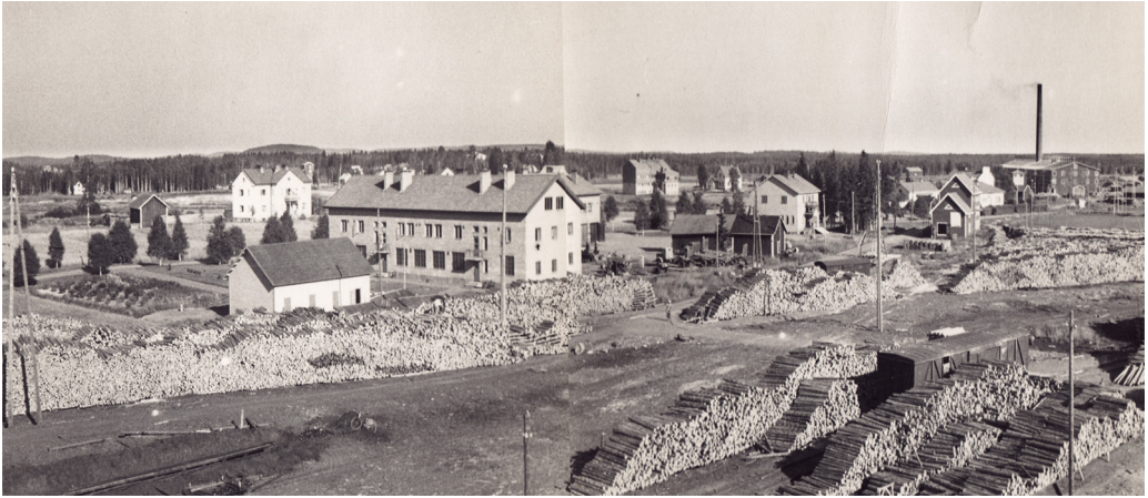
Kuva 2. Maisema Tehdasosuusliikkeen rakennuksille. Tiilitehtaan piippu kohoaa oikealla horisontissa. Kuva on yhdistetty digitaalisesti kahdesta valokuvasta. Kuva ajoittamaton.

selle. Vaikka sopimukset ja rakennuslupa voimalalle saatiin, projekti tyssäsi pääomapulaan. Ongelma ratkesi niin, että Värtsilä-Yhtymä osti kaikki oikeudet ja antoi rakennuttamastaan voimalasta virtaa sopimuksen mukaan Tehdasosuusliikkeelle.