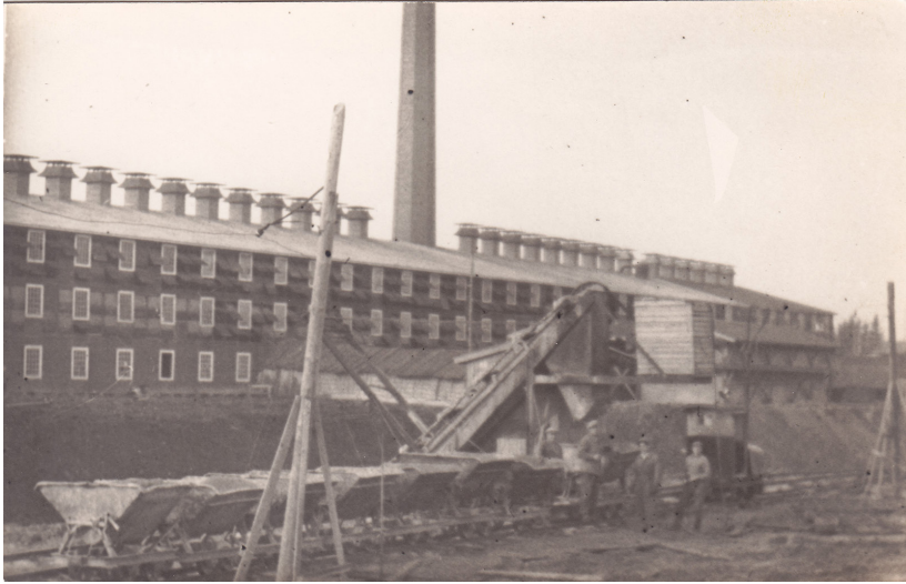
Kuva 3. Taustalla kolmekerroksinen puurakenteinen tiilitehdasrakennus. Ilmanvaihtotorvet peltikaton harjalla ja tuuletusluukkuja seinät täynnä. Etualalla kaukomailla tuotu savenkaivuukone kauhaketjulla. Kuuppavaunujono kapearaisella kenttäradalla. Kuvausvuosi 1952, Tohmajärvi.

Kuvateksteihin on lainattu tekstiä hänen muistiinpanomerkinnöistään. Valokuvat on skannattu originaaleista, eikä niitä ole käsitelty muuten kuin poistamalla tyhjiä alueita.