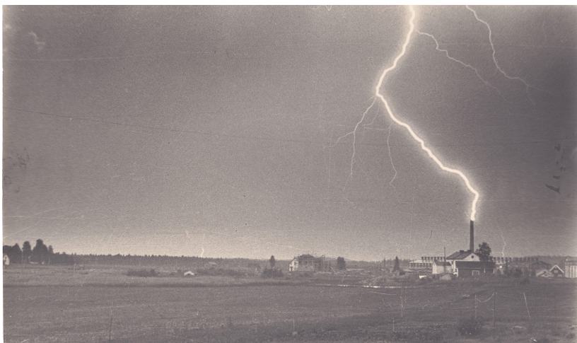
Kuva 4. Salama iski tiilitehtaan savupiippuun ja halkaisi sitä 18 metriä huipusta alaspäin. Kuvauspäivä 5.7.1954, Tohmajärvi.