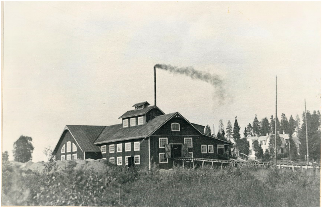
Kuva 1. Tohmajärven turvepehkuosuuskunnan ensimmäinen turvepehkkutehdas kuvattuna 1915–1916. Tehdas paloi 1917. Valokuvaaja tuntematon. Tohmajärven keskusarkisto.

mön eristykseen. Ensimmäinen turvepehkkutehdas valmistui 1908 (kuvassa 1), ja vuoteen 1916 mennessä tehdas tuotti lähes 12 000 turvepaalipehkuu vuodessa. Vuonna 1917 ensimmäinen turvepehkkutehdas paloi, mutta uuden tehtaan valmistuessa tuotanto saatiin nostettua peräti 31560 paaliin huippuvuonna 1927. Tehtaalla otettiin käyttöön turvepehkon kuivaamista varten uudenaikainen haasiakuivausmenetelmä 5 entisen hitaan kekokuivauksen sijaan. Tätä varten tuotiin 10 000 kilon vaunu kuorma Helsingistä käytöstä poistettuja, vähän ruostuneita mutta käyttökelpoisia, galvanoituja rautapuhelinlankoja. Huippuvuosien jälkeen turvepehku tuotanto alkoi vähitellen laskea, kunnes turvepehkon tuotannosta luovuttiin 1950-luvulla 6 .