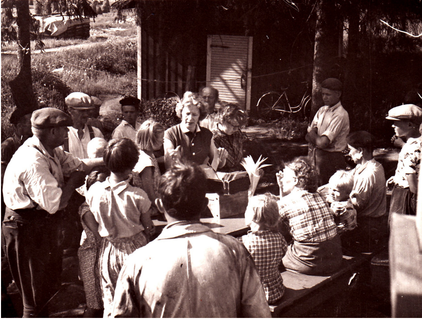
Kuva 5. Tehdasosuusliikkeen työntekijöille jaetaan tilipäivänä tilipussit. Kassarouva kutsuu nimen mainiten ja kirjaa ruksimalla nimen sarakkeeseen. Kaksi todistajaa kirjoittaa sitten nimensä. Kuvausvuosi 1953, Tohmajärvi.