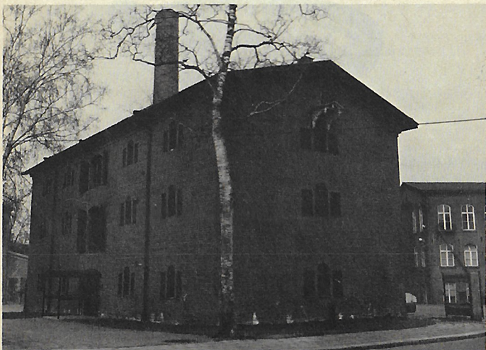
Lounais-Hämeen museoksi peruskorjattu entinen Forssan kehräämön pumpulimakasiini on rakennettu vuonna 1849.

Forssan vanha vaakuna, vuosisadan alun kartta Forssasta ja lähiympäristöstä, vuosisadan alun junalippuja sekä torvisoittokunnan soittimet ovat nähtävyyksiä.