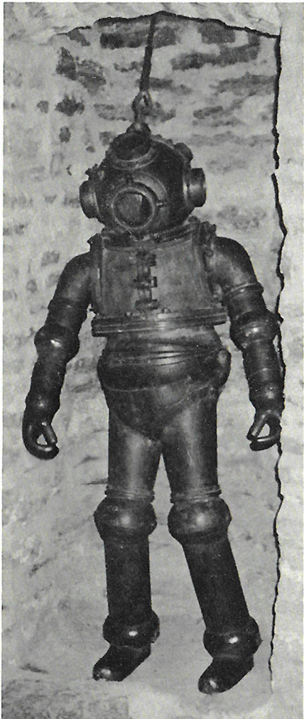
Kuvia Tallinnan merimuseosta. Vasemmalla vanha sukellus”puku”. Oikealla ylhäällä esitellään Eestin kauppalaivaston kokoonpano vuosina 1923 ja 1940 ja sen alapuolella Neuvostoliiton merilaivaston kokoonpano 1.7.1980.

Kiitos Tallinna – tulemme kohta uudelleen!