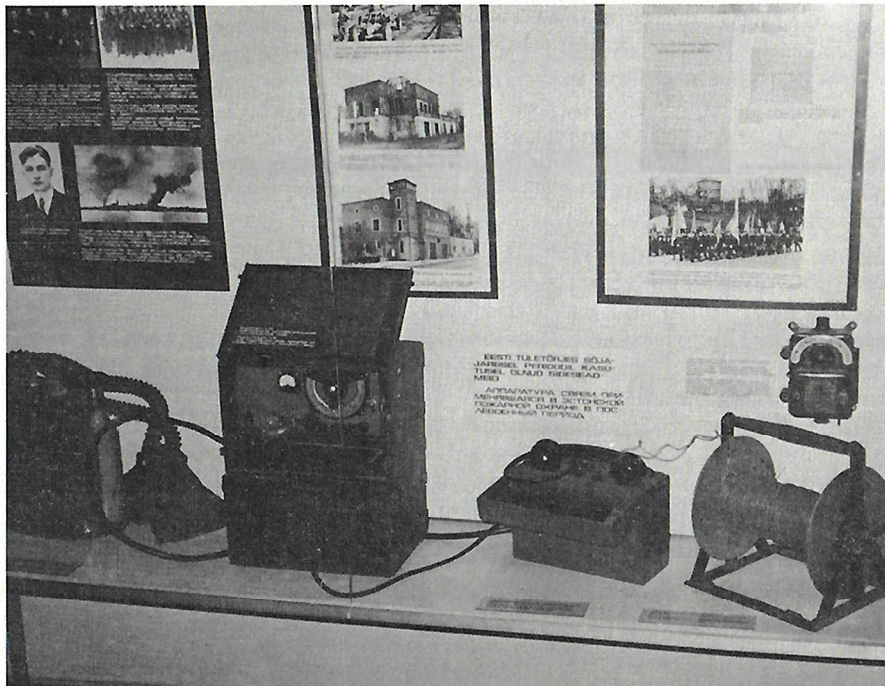
Vanhoja viestintälaitteita Palontorjuntamuseossa.