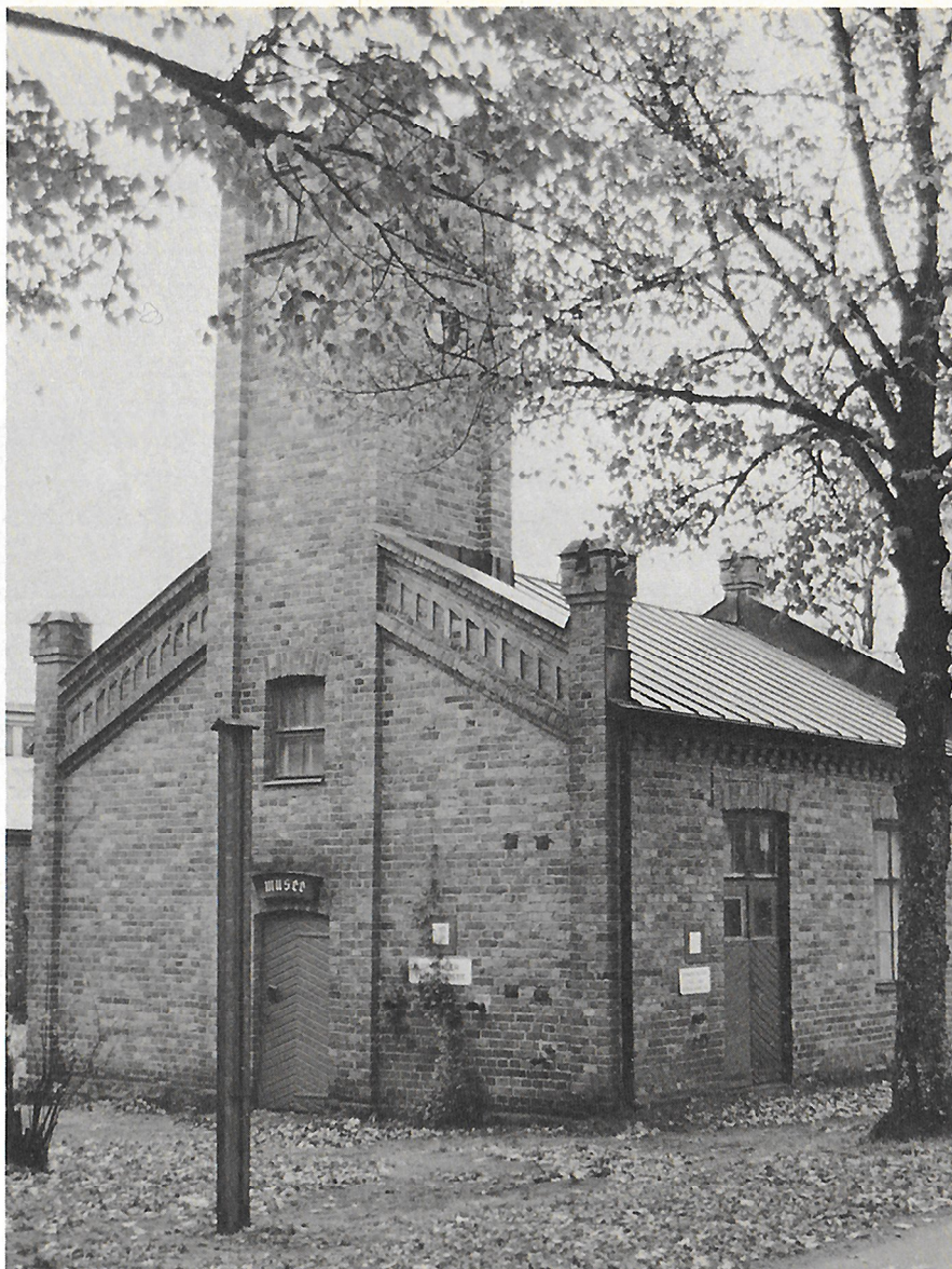
Museorakennus on rakennettu vuonna 1915 tehtaan paloasemaksi.