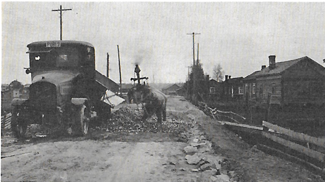
Tienrakentamista höyryjyrän ja kovakumirenkaisen auton voimin jossakin Porin seudulla mahdollisesti 1920-luvulla. Autossa rekisterinumero PORI 9.