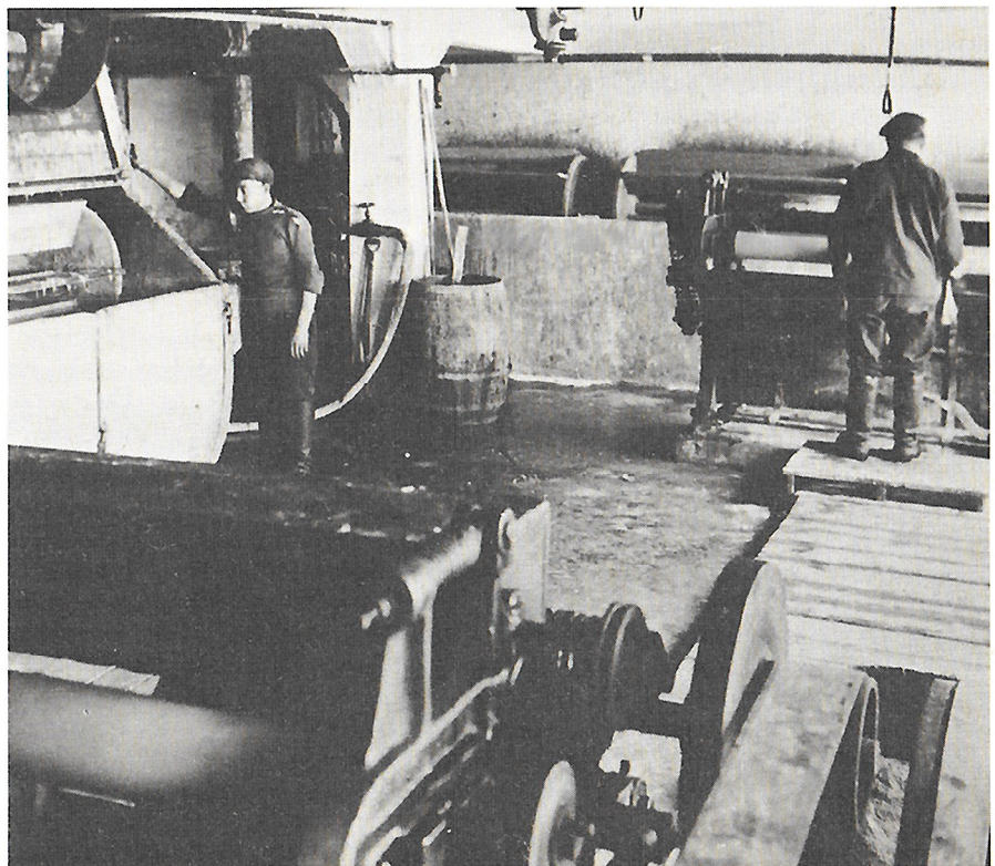
Hagströmin nahkatehtaan märkäosastoa 1930-luvulla.