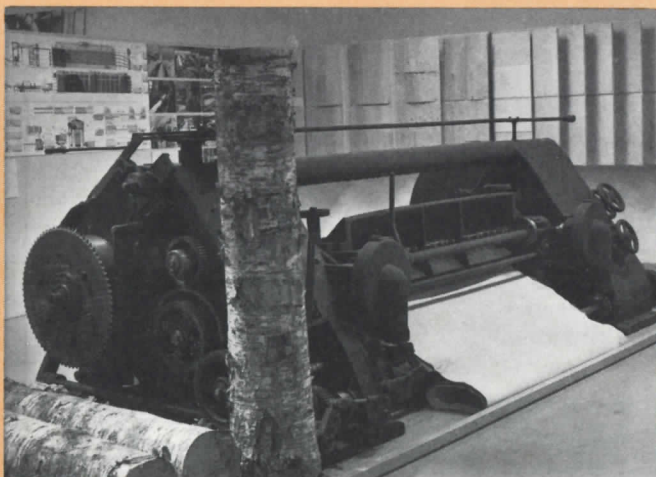
Vanerisorvi 1930-luvulta metsäteollisuusosastolta.

Representanterna för Bruksindustri Ab anser, att bolaget inte är ute efter den unika miljön. Tvärtom anser man att planerna mycket väl tar vara på miljön även om byggnaderna byggs enligt dagens arkitektur. Planerna har avancerat så långt att de i princip är godkända av museiverket.