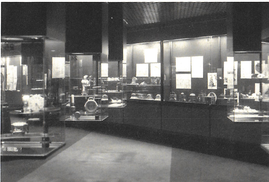
Yleiskuva Suomen Kellomuseosta.

Suomen Kellomuseo on avoinna ti—su klo 12—16. Museon toimisto on avoinna ma—pe klo 9—16. Osoite Opinkuja 2, Espoon Tapiolassa. Puh. (90) 466 900. Pääsymaksu 10/5 mk.