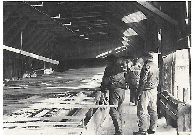
Sahatut laudat lajitellaan lajittelepöydällä vanhaan tapaan käsivoimin.