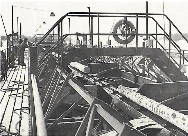
Tukkeja sahataan Penttilän sahalla talvella 1988.