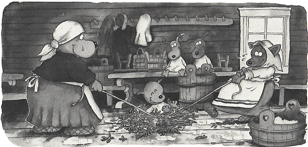
Sitten tulee joulu. Fiina-emäntä ja Miina valmistavat monenlaisia jouluruokia. Tuvan suuressa uunissa paistetaan joululeipiä ja saunassa pannaan olutta.

Mauri Kunnaksen kirjojen tarttuvan lämmön ja iloisen tunnelman on hurmannut suomalaisten lasten — ja aikuisten — lisäksi lapset jo Japanisakin. Mauri Kunnaksen kirjoja on julkaistu myös englanniksi, saksaksi, ranskaksi, italiaksi, ruotsiksi, norjaksi, tanskaksi, islanniksi ja latviaksi.