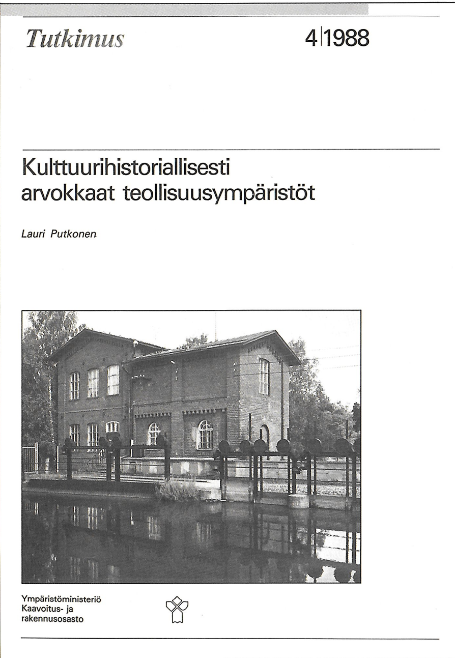
Forssan vuonna 1877 rakennettu voimala on maamme teollisista voimalaitoksista vanhin ja ainutlaatuisen hyvin säilynyt. Sitä on laajennettu 1880-luvulla ja vuonna 1899.

Selvitykseen sisältyy katsaus vanhojen teollisuusympäristöjen ja -rakennusten uudelleenkäyttöön muutaman esimerkin valossa. Lisäksi tutkimuksen liitteinä on luettelot vanhojen teollisuusalueiden ja -rakennusten uusista käyttömuodoista sekä teollisuusmuseoista.