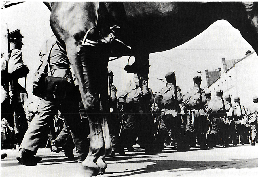
Viipurin paraati.

Teossarjan viimeisessä osassa käsitellään myös Suomen siirtymistä sodasta rauhaan vuosina 1945—48. Suomalaisen yhteiskunnan paradokseihin kuului noina niin sanottuina »vaaran vuosina» se, että moni Kannaksen hiljaisista sankareista antoi äänensä keväällä 1945 kommunisteille. Siirtoväki asetettiin lopullisesti vuosina 1945—48. Lähes kymmenen vuotta jatkuneen evakkotai-paleensa ajan karjalaiset olivat säilyttäneet otteensa yhteiskunnalliseen valtaan. Tätä voidaan pitää merkinä suomalaisen demokratian syvyydestä. »Vaaran vuosien» — useimmille kuitenkin toivon ja uuden elämän vuosien — todellisuutta olivat tuolloin syntyneet suuret ikäluokat, joiden juuret oli-