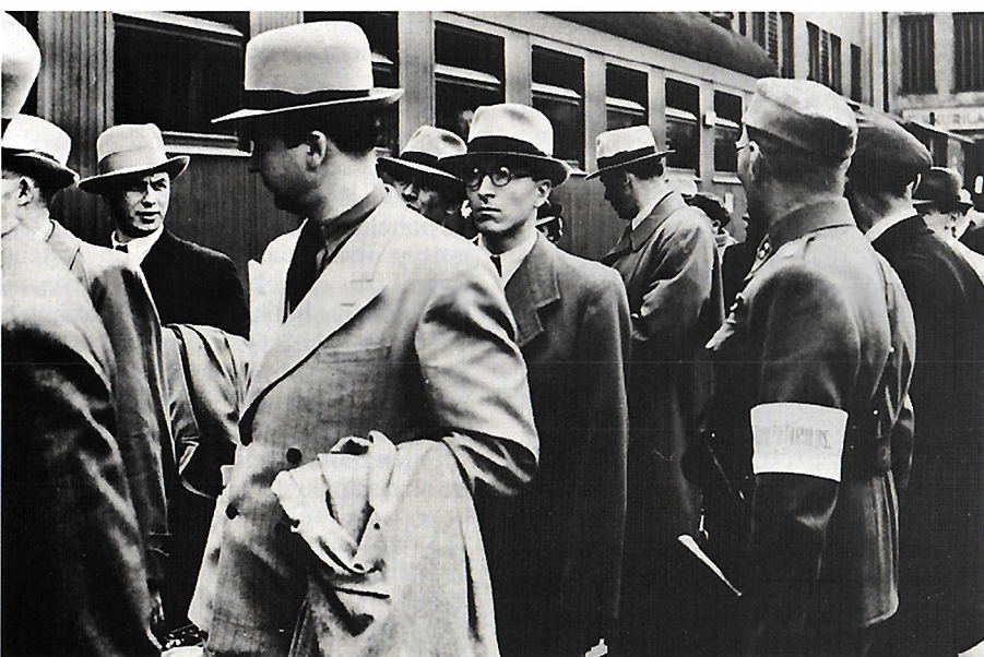
Jatkosota. Neuvostoliiton lähetystö poistuu Helsingistä 24. 6. 1941.