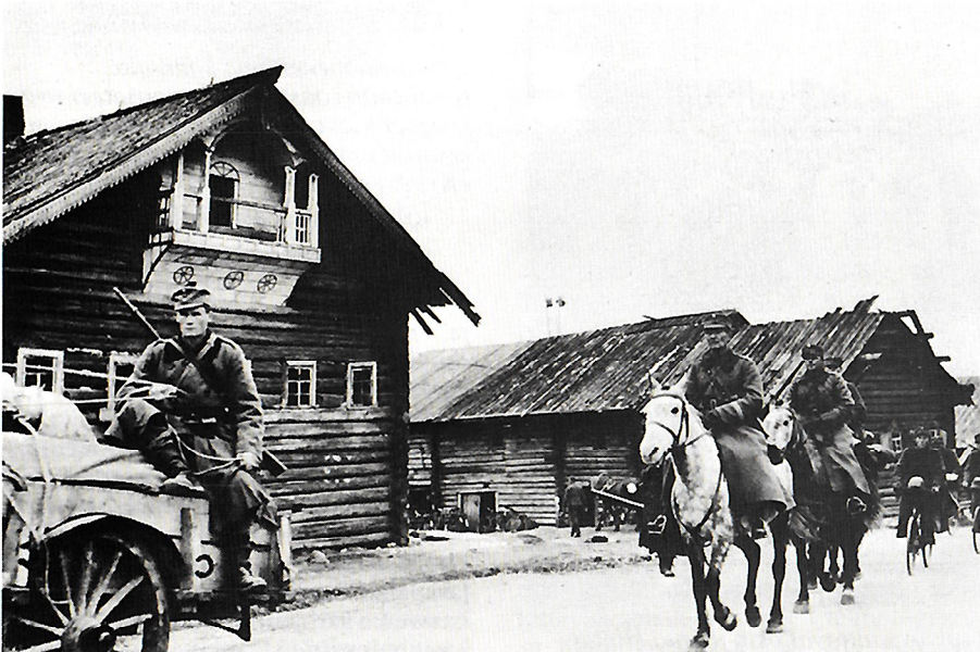
Jatkosota. Hyökkäys Itä-Karjalaan.