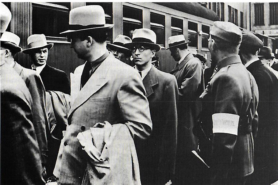
Jatkosota. Neuvostoliiton lähetystö poistuu Helsingistä 24. 6. 1941.