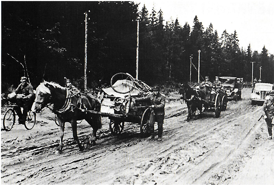
Jatkosota. Suomi hyökkää. A-kuva