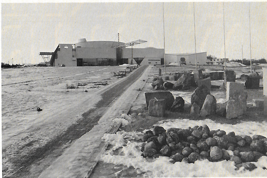
Näkymä Suomalaisen Tiedekeskus Heurekan Tiedepuistosta, pääsisäänkäynnin suunnalta. Etualalla ainutlaatuinen geologinen näyttely Suomen kallioperästä. Kivitarhaan on kuljetettu 180 kivenjärkeä eri puolilta Suomea.

Verne-teatteri on sekä planetaario että superelokuvateatteri, jossa voi kokea huimia elämyksiä 500 m 2 kuvulle heijastettujen ohjelmien myötä. Superelokuvaa katsellessa tuntee olevansa täysin tapahtumissa ”sisällä” — esim. lentämässä kanjonissa veden pintaa hipoen tai ajamassa junalla huimaa vauhtia kuljettajan paikalla. Lisäksi käytävissä on videopanoraamaruudukko ja äänentoisto kuudelta kanavalta eri puolilta kupua. Mullistavana uutuutena on Vernessä kehitetty diaprojektori, joka heijastaa 75 mm läpimittaisia pyöreitä dioja Verne-teatterin koko kuvulle. — Tervemenoa Heurekaan.